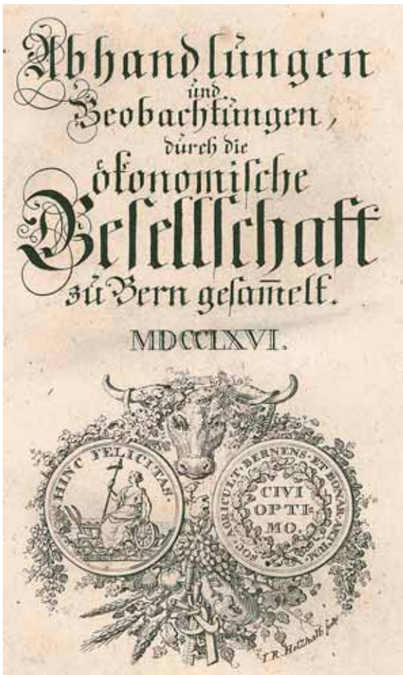
Abb. 1. Mit der Qualität ihrer Beiträge und der Breite ihrer Inhalte waren die Abhandlungen und Beobachtungen durch die Oekonomische Gesellschaft zu Bern gesammelt eine wichtige Stimme in der europäischen Ökonomischen Aufklärung.

Die schweizerischen Vertreter dieser europaweiten Reformbewegung – sie werden als Ökonomische Patrioten bezeichnet – liessen sich von den einschlägigen internationalen Publikationen inspirieren und übertrugen sie auf ihre eigenen Regionen. Geradezu exemplarisch tun sie dies etwa im 1760 veröffentlichten Freyen Auszug einer schwedischen Abhandlung von der Landhaushaltung. Auf unsern schweizerischen Horizont gerichtet , wo sowohl die ökonomische Sicht auf die nützliche Natur als auch die internationale Konkurrenzsituation pointiert zum Ausdruck gebracht werden: «Unsere Berge und Wälder sind wahre Quellen des Reichthums. Unsere Erde ist so fruchtbar als eine andere, wenn die Kunst der Natur zu Hülfe kommt. ... Es ist rühmlicher, eigene Länder zu verbessern, als fremde zu erobern.» 6