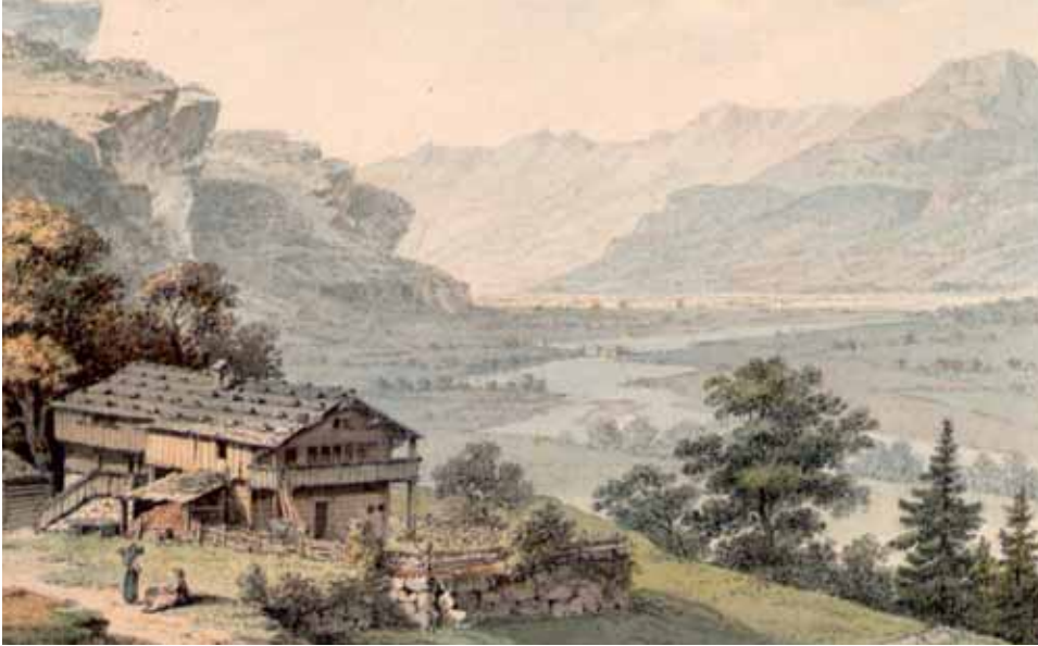
Abb. 3. Blick auf die hauptsächlich als feuchtes Allmendland genutzte Ebene des Haslitals mit der mäandrierenden Aare. Feder und Aquarell von J.L. Aberli (1769). Graphische Sammlung Wien [Ausschnitt], Albertina Wien.