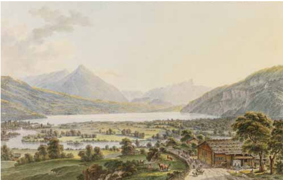
Abb. 4. Aaremündung in den Thunersee, Gsteig bei Interlaken. Kolorierte Umrissradierung von H. Rieter (1812).