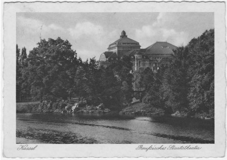
Aus dem Nachlass: Preußisches Staatstheater Kassel, um 1930.

Es entstand mit ihrem Buch nicht nur der Bericht ihrer eigenen Lebensgeschichte, sondern auch ein wunderbares, authentisches Zeitdokument, das symptomatisch für diejenigen, die das Dritte Reich erlebt hatten, war. Ihre Tochter konnte es 2014 publizieren.