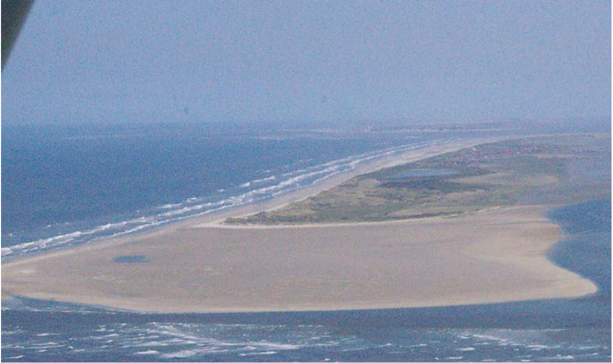
Die Spitze der Haakdünen und davor das gewaltige Billriff