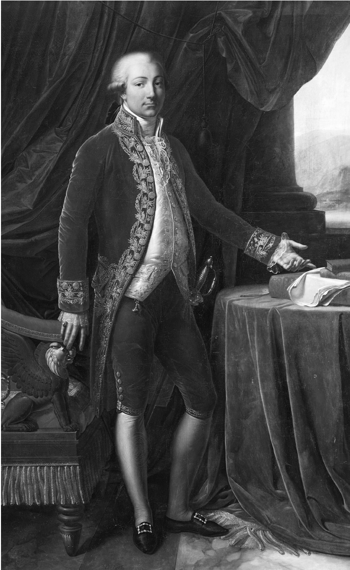
Der Vater Carlo Maria Buonaparte, Gemälde (um 1804) von Anne-Louis Girodet-Trioson.