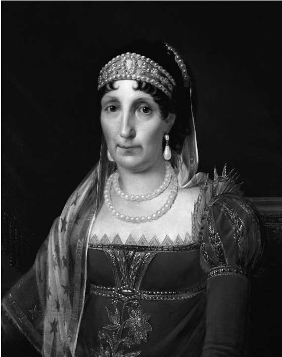
Die Mutter Letizia Ramolino Bonaparte, Gemälde (um 1804) von François Pascal Simon Gérard.

zurück auf einen Ghibellinen, der 1120 wegen seiner Anhänglichkeit an das staufische Kaiserhaus aus Florenz habe fliehen müssen. 11 Lässt man den Ghibellinen beiseite, spricht wirklich viel für die Herkunftsregion Toskana. Die korsischen Bonapartes lassen die Verbindung mit dem italienischen Festland nie abreißen. Man ist des Italienischen mächtig, die Söhne werden zum Studieren über das Tyrrhenische Meer geschickt. Carlo Bonaparte studiert Jura an der Universität von Pisa, Joseph, sein Ältester, tut es ihm nach. Von sich sagt Napoleon: „Ich bin eher Italiener oder Toskane als Korse.“ 12