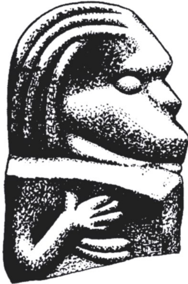
Goldblech aus Bolmsö