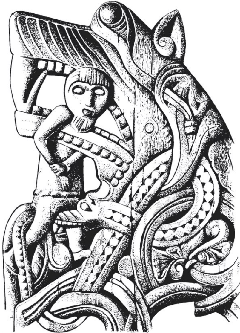
Schnitzerei an der Stabkirche in Hylestad (Portal)

Slidr und Hridr, Sylgr und Ylgr, Wid, Leiptr und Giöll 18 , welcher der nächste beim Höllentor ist.«