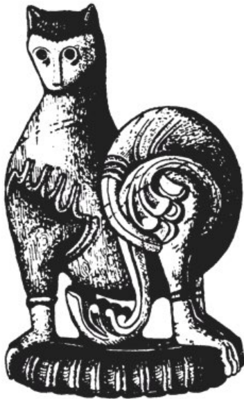
Schnitzerei an der Stabkirche in Hylestad

Diesen Schatz hob Bischof Brynjulf Swendson, der höchste christliche Würdenträger Islands seiner Zeit. Er entdeckte im Jahr 1643 eine alte Liederhandschrift und stellte fest, dass er zumindest einen Teil von Snorris Quelle gefunden hatte. Denn vereinzelt der vielen hundert Verse stimmten wörtlich mit den zitierten Strophen aus der Prosa-Edda überein, auch ergänzten viele Lieder die von Snorri in reportagehafter Straffung dargestellten Sagen.