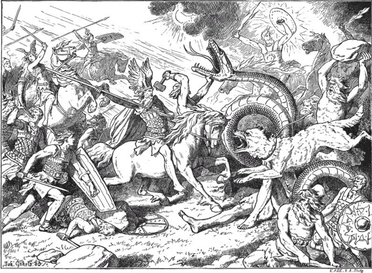
Johannes Gehrts: Der letzte Kampf. Illustration um 1880