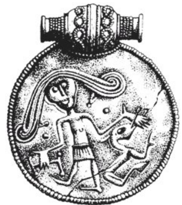
Doppelumulett mit Tyr und dem Fenrirwolf. Trollhättan

Wenn wir von Edda sprechen, meinen wir Prosa-Edda und Lieder-Edda.