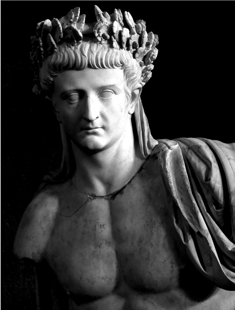
Porträt des Tiberius aus Caere (Cerverteri)

Hossenberg, im Herbst 2020 Manfred Clauss