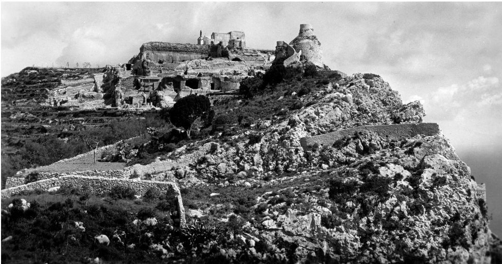
Die „Villa Iovis“ auf Capri

Handelte es sich um eine spontane Entscheidung? Oder hatte er diesen Schritt schon lange vorbereitet? Die Quellen sind bei der Beantwortung dieser Fragen keine große Hilfe. Sie sind von der Tendenz geprägt, die Dinge von ihrem Ausgang her und nicht in ihrer Entwicklung zu betrachten. Sueton behauptet, Tiberius habe die Termine in Capua und Nola nur als Vorwand benutzt, um unverdächtig nach Kampanien reisen und seinen Capri-Traum verwirklichen zu können. 7 Das ist natürlich pure Vermutung, denn wenn es so gewesen wäre, hätte Tiberius darüber kaum offen Auskunft gegeben. Mitteilksam war der Kaiser, was seine Person, seine Pläne, sein Denken anging, grundsätzlich nicht. Damit öffnete er Spekulationen und Mutmaßungen jedweder Art Tür und Tor. Über den eigenwilligen Kaiser konnte man daher alles behaupten, ohne in die Verlegenheit zu geraten, den Beweis dafür erbringen zu müssen. Und so kursierten in Rom, wo die Gerüchteküche immer besonders heftig brodelte, bald die wildesten Spekulationen über das, was sich in der kaiserlichen Villa auf Capri abspielte – Orgien, die alles in den Schatten stellten, was man sonst an spektakulären Veranstaltungen in den oberen Kreisen kannte. Zustände wie im alten Rom, wie es sprichwörtlich heißt – nur eben auf Capri.