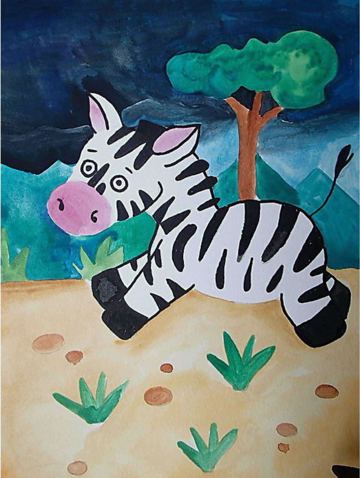
Zoey in der Savanne