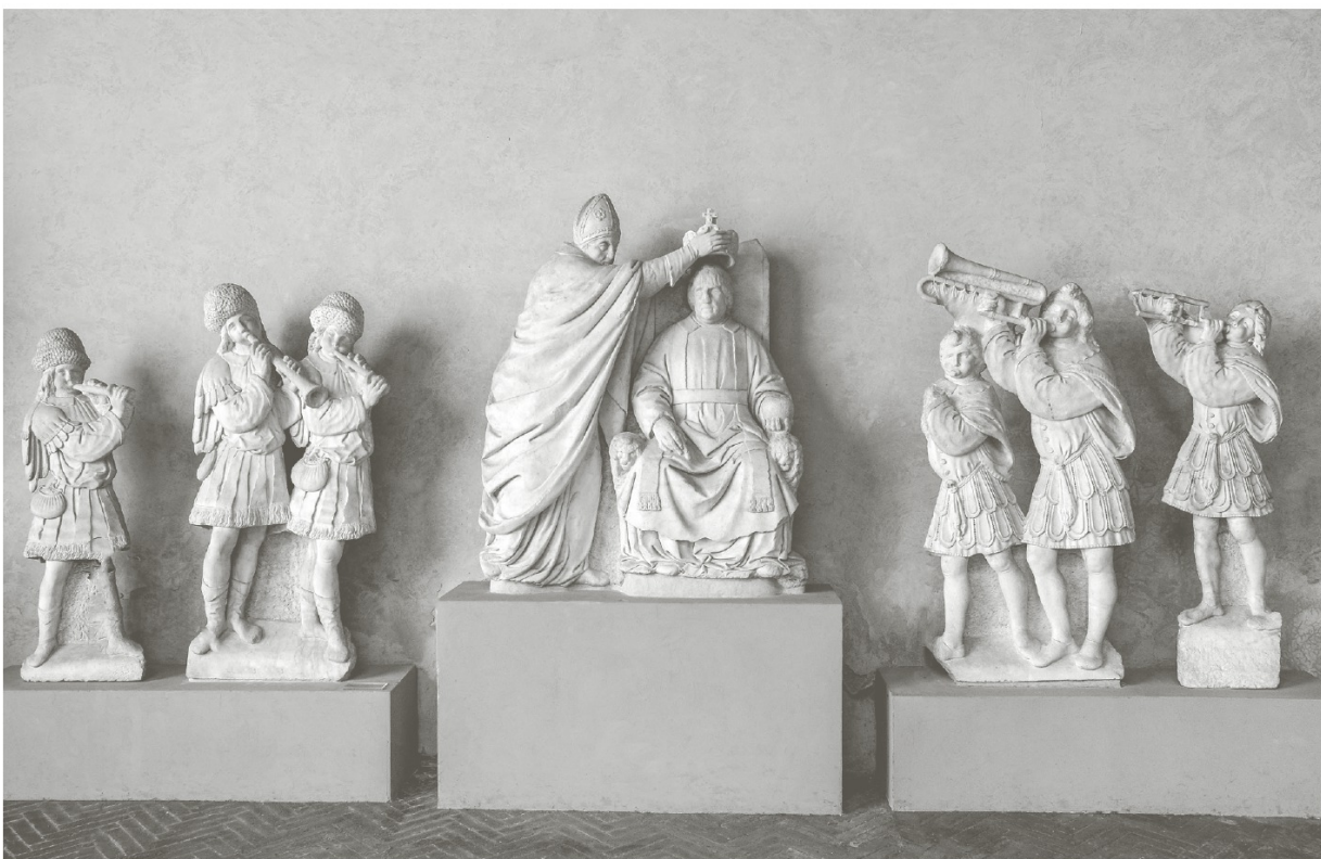
Benedetto da Maiano, Drei Pfeifer (links), Skulpturengruppe Incoronazione di Ferdinando d'Aragona , Marmor, Florenz, Museo Nazionale del Bargello