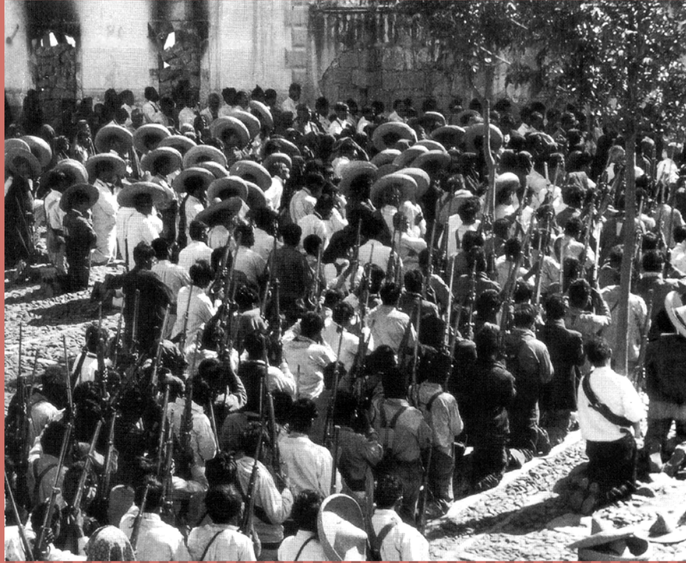
Grupo de cristeros.