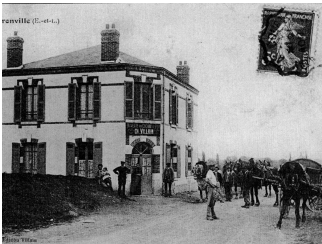
« Buvette du chemin de fer. CH. VILLAIN »

Le café - restaurant d'Odette existait déjà il y a plus de cent ans