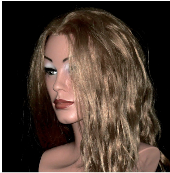
▲ Die maximale Reichweite im Innenraum beträgt bei ISO 800 immerhin etwa vier Meter.

Speziell bei Kompaktkameras mit sehr leistungsschwachen Blitzgeräten wird herstellereitig gern bei Angabe der Leitzahl in Verbindung mit sehr hohen ISO-Werten getrickst. Denn bereits bei ISO 200 steigt die Leitzahl auf das