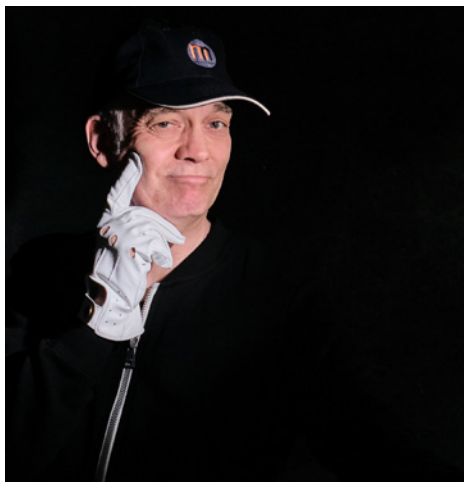
▲ Selbstbildnis mit dem entfesselten Blitz in der „verlängerten“ linken Hand.

Ich hoffe, dass Sie nach dem Studium dieses Buchs aus Ihrer eigenen Motivation heraus – unabhängig von Licht- und Witterungsbedingungen – mit Kamera und Blitzgerät auf Motivjagd gehen. Und ich wünsche Ihnen viel Spaß und Erfolg beim Ausprobieren und natürlich vorzeigbare Aufnahmen, die Ihnen so schnell keiner nachmacht.