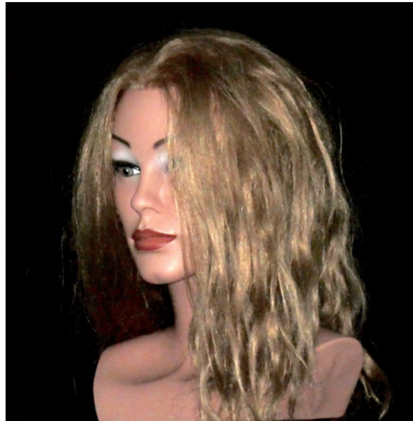
▲ Viel nützt wenig, wenn die Bildqualität zu sehr leidet. Bei ISO 3200 erhöht sich zwar die Reichweite auf etwa acht Meter (Lz ca. 33), jedoch nimmt die Bildqualität rapide ab und ist nicht mehr akzeptabel.

Auch die Anschaffung eines lichtstarken Objektivs ist langfristig gesehen sinnvoll, wenn Sie auf hohe ISO-Werte zugunsten einer besseren Bildqualität verzichten möchten und mehr Spielraum in der Bildgestaltung wünschen. Außerdem können Sie, neben dem oftmals schönen Bokeh des Objektivs, das vorhandene Licht besser in das Gesamtbild einbeziehen. Pro Blendenstufe erzielen Sie eine Steigerung der angegebenen Leitzahl um den Faktor 1,4. Leider sind die lichtstarken Schätzchen schwerer und auch teurer.