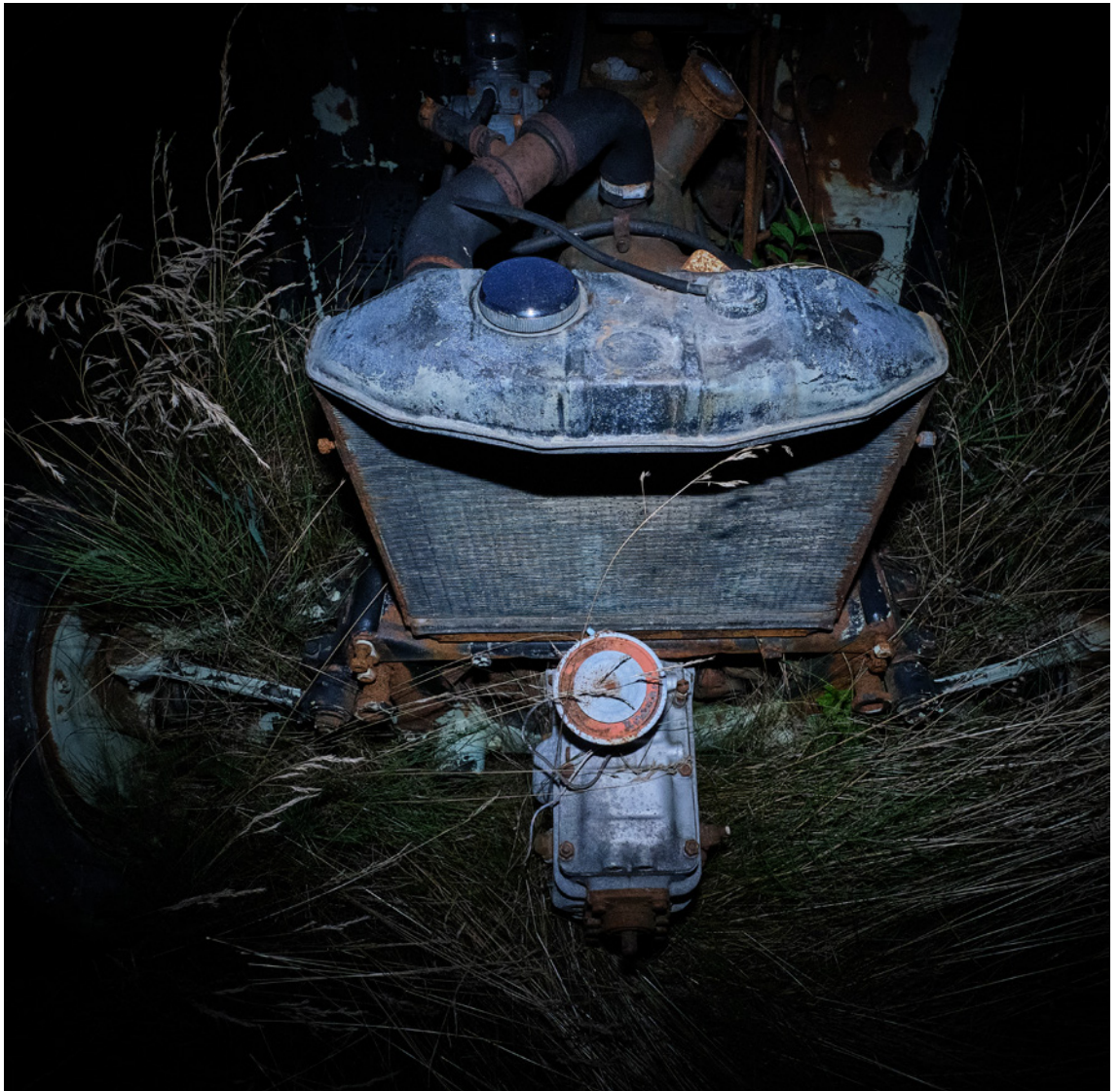
▲ Direkt und hart geblitzt. Der Hintergrund wurde aufgrund der kleinen Blende unterbelichtet. f/9 | 1/40 s | ISO 6400 | -2 EV | WB 5.000 K | Blitz manuell 1/64 | frontal mit MagGrid