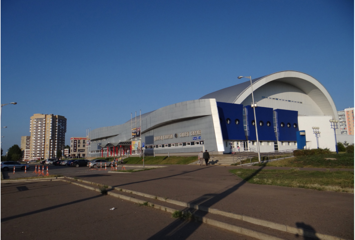
Eissporthalle Дворец ледникового спорта