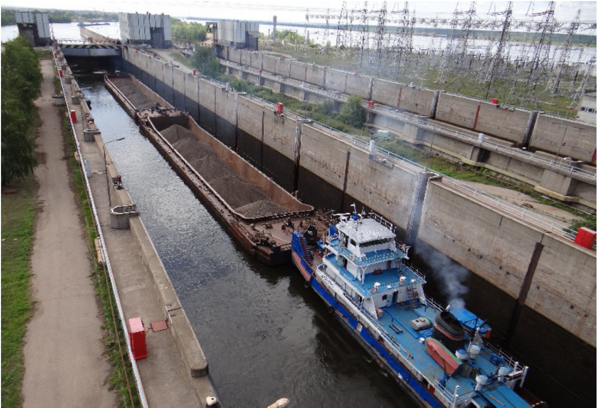
Schleuse des Nischnekamsker Wasserkraftwerkes Судоходный шлюз Нижнекамской ГЭС