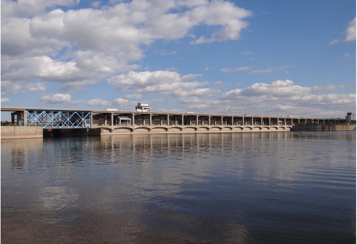
Nischnekamsker Damm Нижнекамская плотина