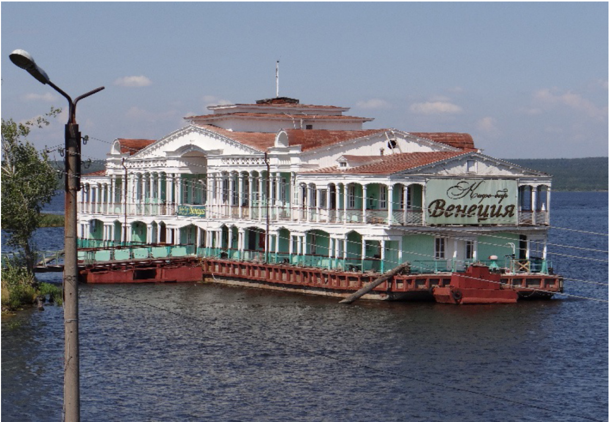
Gaststätte „Venedig“ Ресторан „Венеция“