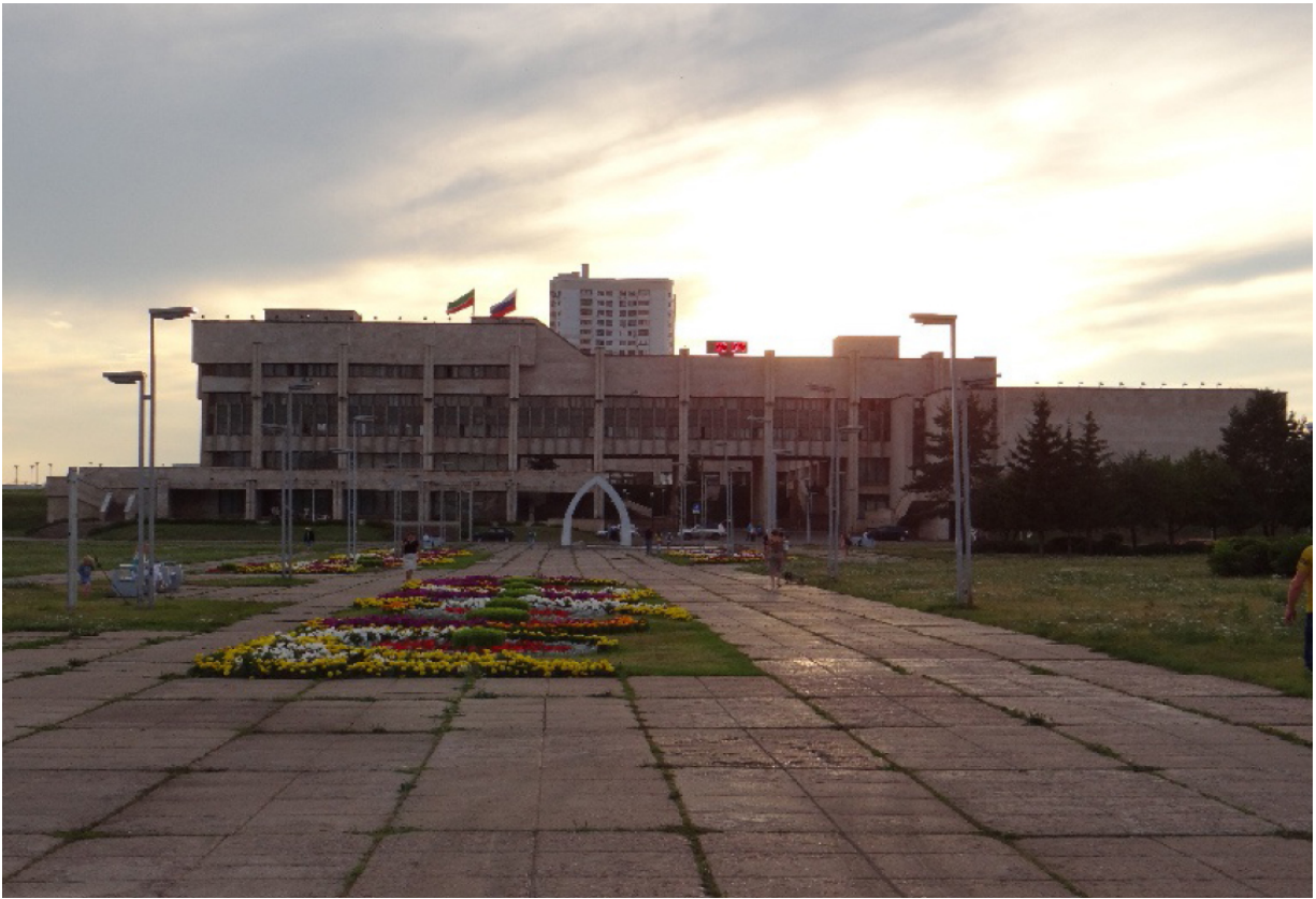
Rathaus der Stadt Nabereschnyje Tschelny, der Platz Asatlyk (auf tatarisch - die Freiheit)

Исполнительный комитет города Набережные Челны, Площадь Азатлык (с татарского - Свобода)