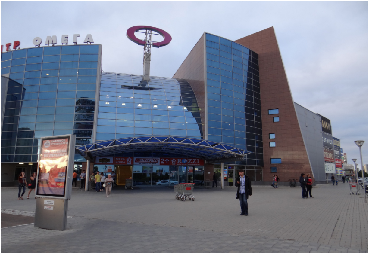
Einkaufszentrum „Omega“ Торговый центр „Омега“