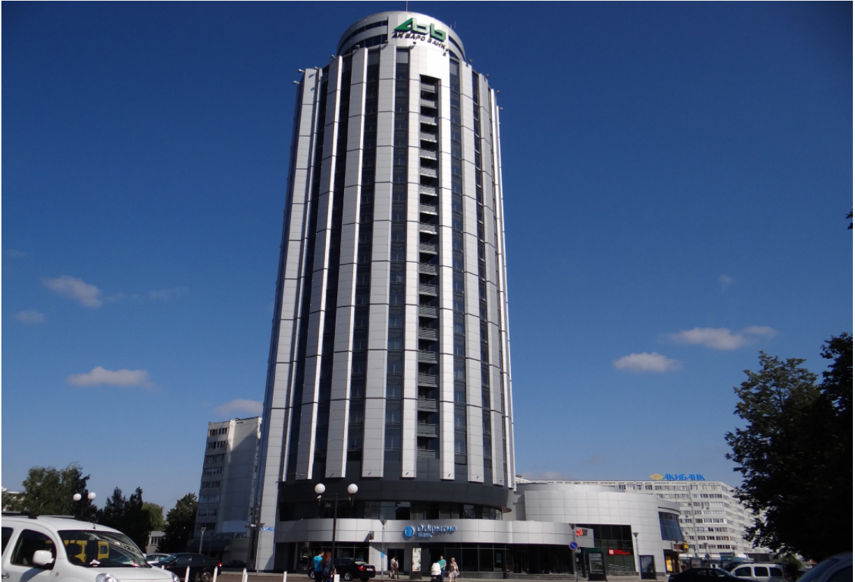
Das Businesszentrum Бизнес-центр