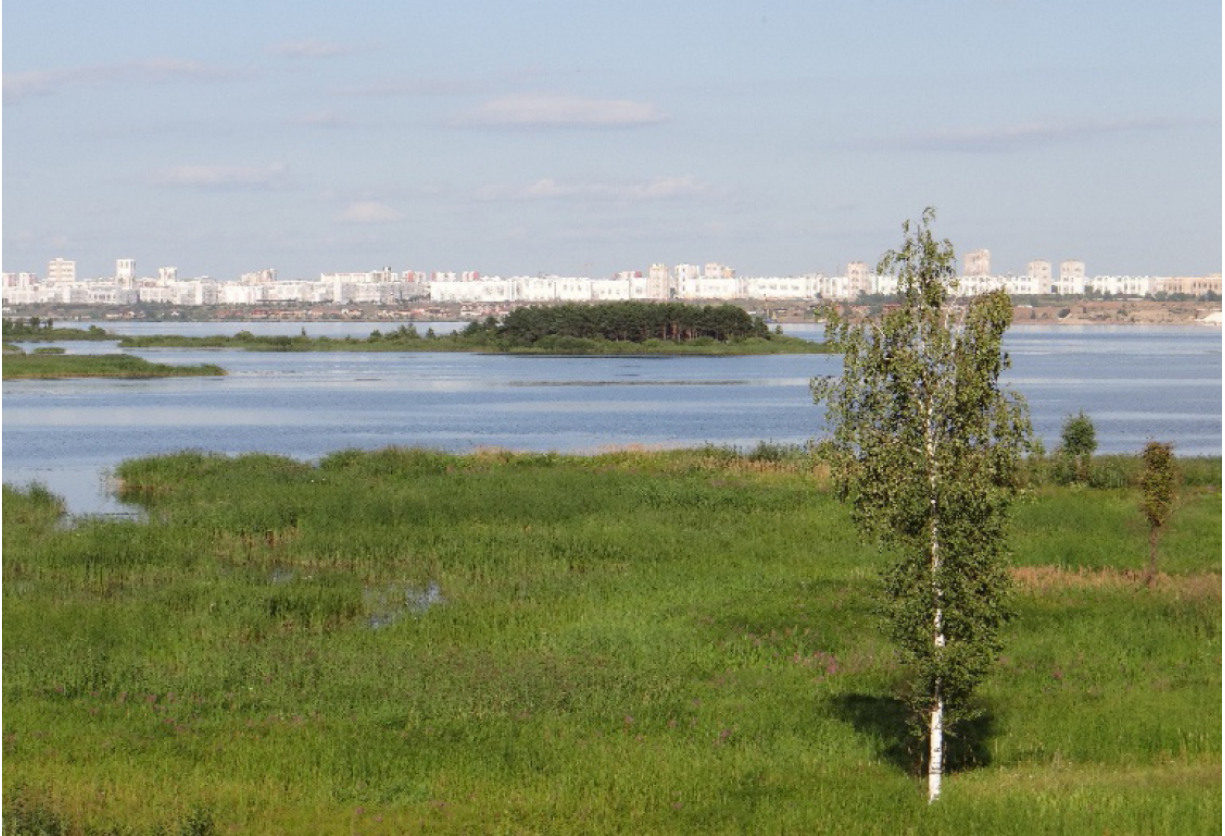
Der Nischnekamsker Stausee Нижнекамское водохранилище