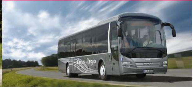
▪ MAN Lion's Regio