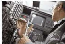
Services/ After Sales & Parts