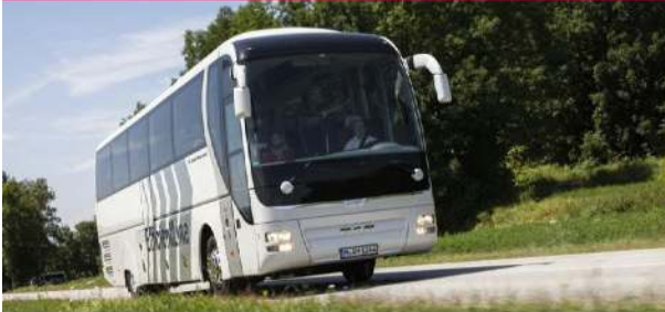
▪ MAN Lion's Coach