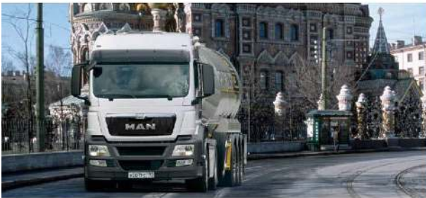
▪ MAN TGS WW