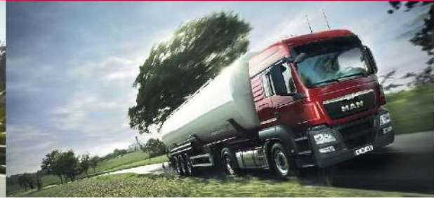
▪ MAN TGS