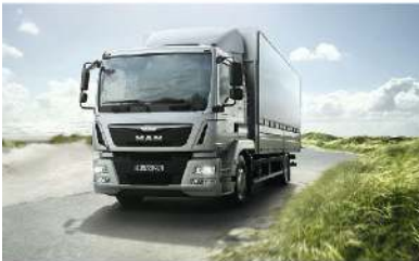
▪ MAN TGM