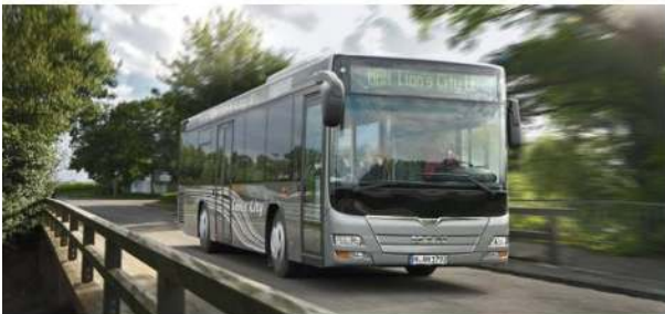
▪ MAN Lion's City