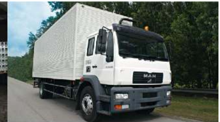
▪ MAN CLA