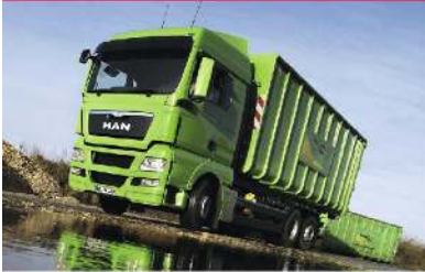
▪ MAN TGX