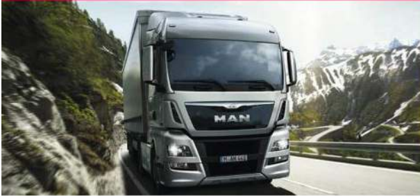
▪ MAN TGX