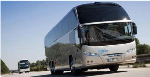
▪ NEOPLAN Cityliner