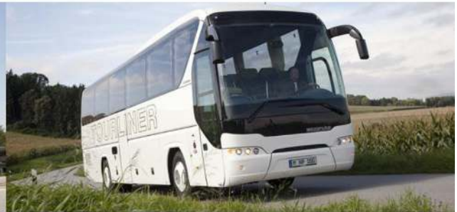
▪ NEOPLAN Tourliner