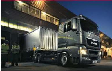
▪ MAN TGX