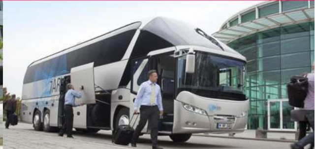
▪ NEOPLAN Starliner