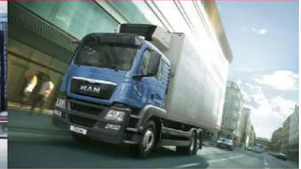
▪ MAN TGS VWV