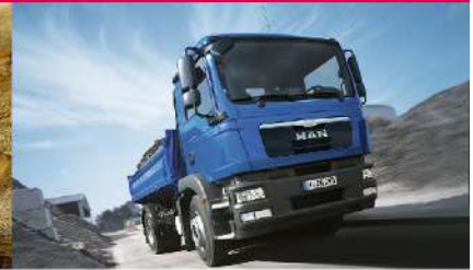
▪ MAN TGM