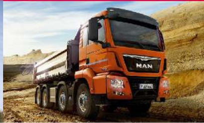
▪ MAN TGS