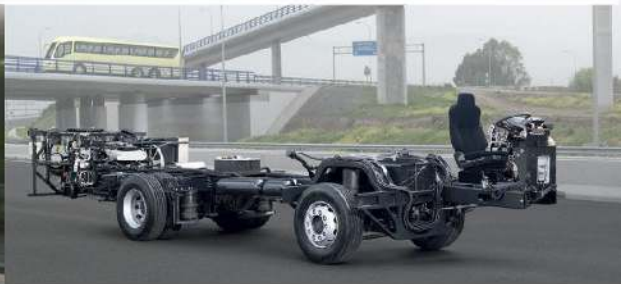
▪ MAN Chassis