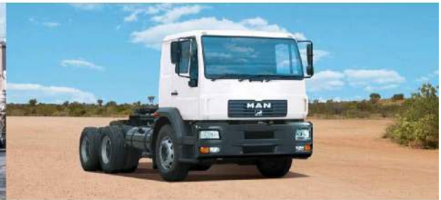
▪ MAN CLA