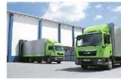
Leichte und mittel-schwere Lastwagen