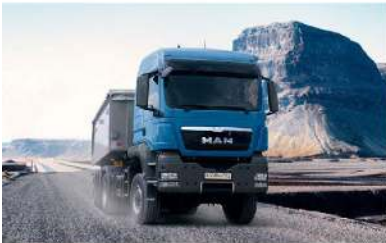
▪ MAN TGS WW