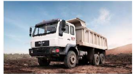
▪ MAN CLA