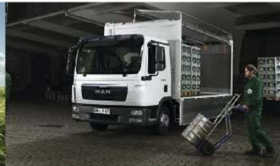
▪ MAN TGL