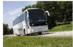
Busse (MAN und NEOPLAN)