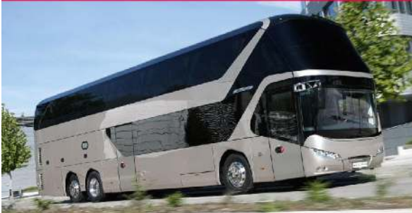
▪ NEOPLAN Skyliner