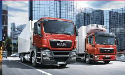
▪ MAN TGS