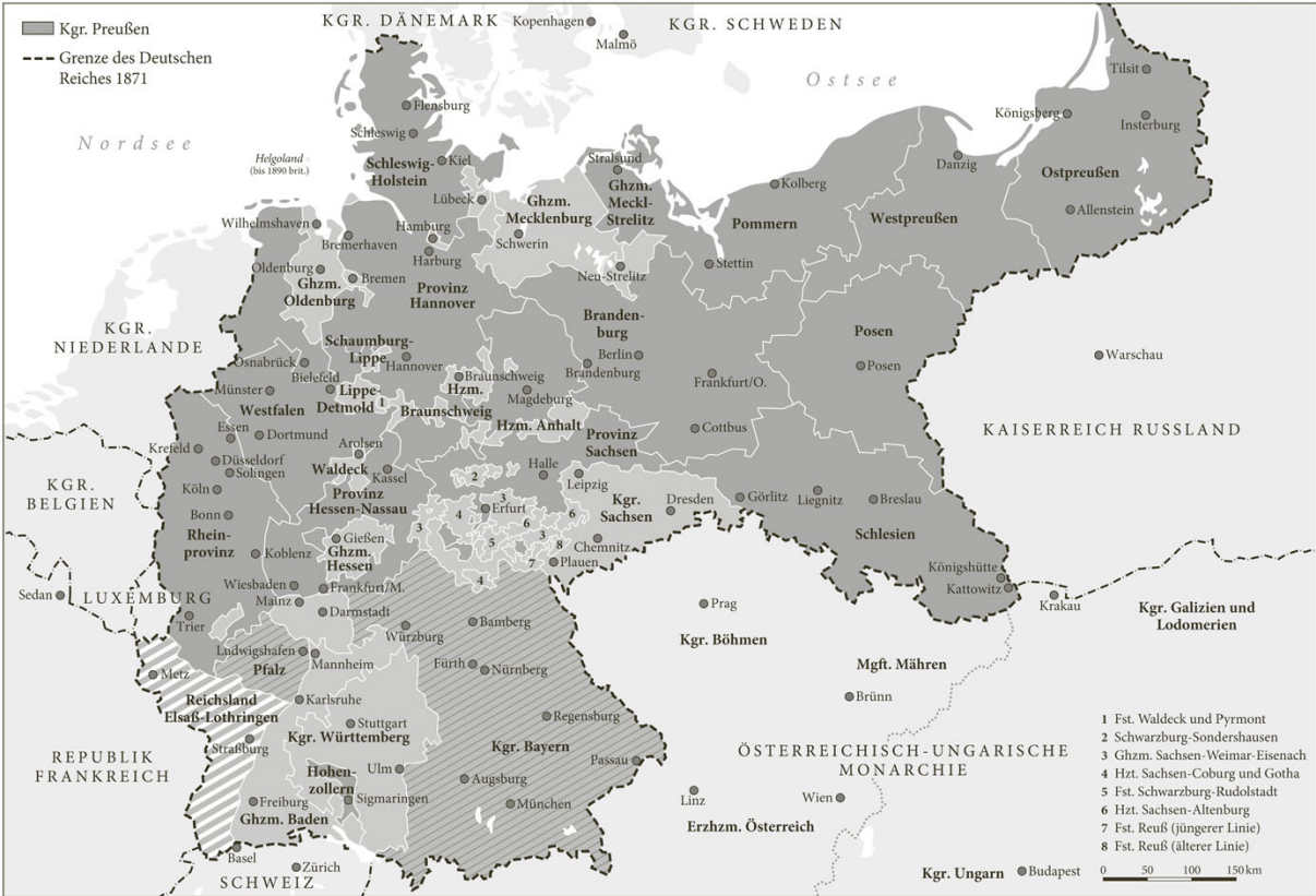
Das Deutsche Reich 1871 bis 1918

als Bundesstaat erzeugte, bestimmte folglich den Verlauf der deutschen und europäischen Geschichte an der Wende vom 19. zum 20. Jahrhundert ganz entscheidend mit. So sind die Auswirkungen des „ewigen Bundes“, den die deutschen Fürsten vor 150 Jahren unter der Ägide Bismarcks schlossen, in vielerlei Hinsicht bis heute spürbar.