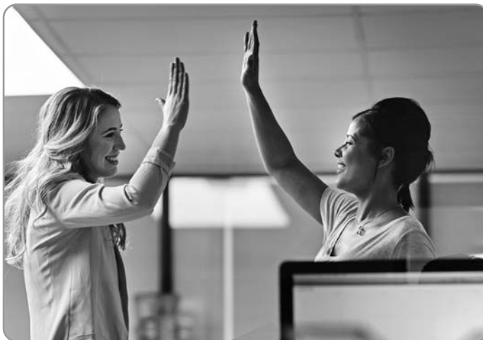
Abbildung 1: „Wärmeaustausch“

Für das Gefühl von sozialer Sicherheit benötigen wir daher ein kleines Vertrauenszeichen, um in Verbindung gehen zu können und dabei wirken Signale über den Tastsinn besonders gut. Bleibt dieses „Humanonline-Manöver“ aus, verstehen Menschen zwar, was das Gegenüber sagt, aber sie verspüren kaum Impulse, dem Inhalt zu trauen, ihn ernst zu nehmen oder gar umzusetzen – vor allem, wenn Mimik und Gestik, also der motorische Ausdruck, inkongruent herüberkommen (Merhabian, 2007). Gerade auch Begrüßungsrituale, die über eine gleichgeschaltete Motorik und Hautkontakt laufen, können eine erstaunliche zwischenmenschliche Wirkung haben. So berichtet Martin Grunwald in seinem Buch Homo hapticus , dass wir auch beim Körperkontakt hoch sensibel auf die gefühlte Temperatur reagieren und es daher zu Redewendungen kommt wie jemand habe ein „warmes Herz“ oder zeige die „kalte Schulter“ (Grunwald, 2017). Das „Hinfühlen“ beim ersten Kontakt entspringt offensichtlich dem Bedürfnis der Mitmenschen, auch haptische Informationen von seinem Gegenüber aufzunehmen, um ihn mit allen Sinnen „erfassen“ zu können.