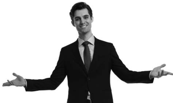
Abbildung 2: Humanonline – die Motorik mit einbeziehen

Aus diesem Grund verstärken wir beim Online-Coaching immer wieder spontan gezeigte Bewegungen, die in die ressourcenreiche Richtung gehen. Sagt beispielsweise ein Coachee: „Das ist eine gute Idee!“ und bewegt dazu die Arme, bitten wir ihn oder sie, diese Armbewegung im Zusammenhang mit dem Satz zu wiederholen. Als nächsten Schritt denkt der Coachee dann an eine zukünftige Situation, in der er oder sie die Idee umsetzen wird und wiederholt dabei den Satz, kombiniert mit der Armmotorik. So wird der Satz mit dem Muskelgedächtnis und damit mit einer Körperaktivität verknüpft. Auf diese Weise verstärken wir den gesamten positiven Sinneseindruck mit einem Maximum an Sinnesreizen – zumindest im Online-Kontext.