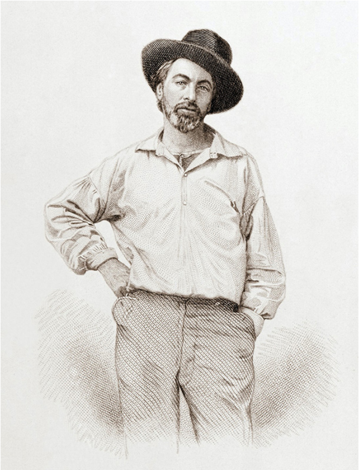
Walt Whitman, Stahlstich (Samuel Hollyer)