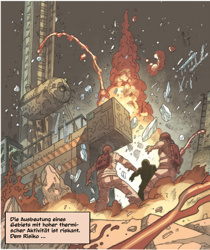
Die Ausbeutung eines Gebiets mit hoher thermischer Aktivität ist riskant. Dem Risiko ...