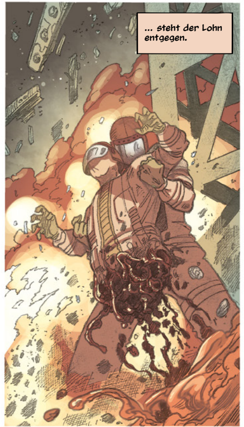
... steht der Lohn entgegen.