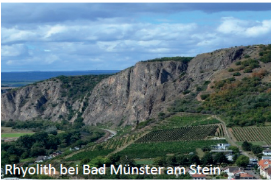
Rhyolith bei Bad Münster am Stein