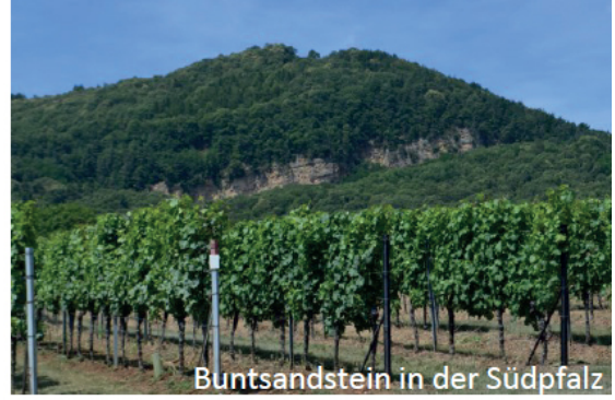
Buntsandstein in der Südpfalz