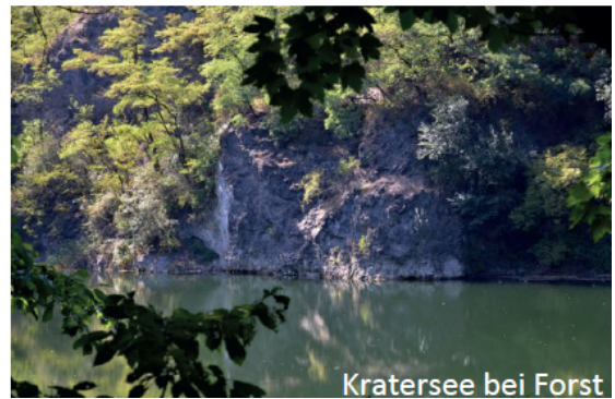
Kratersee bei Forst