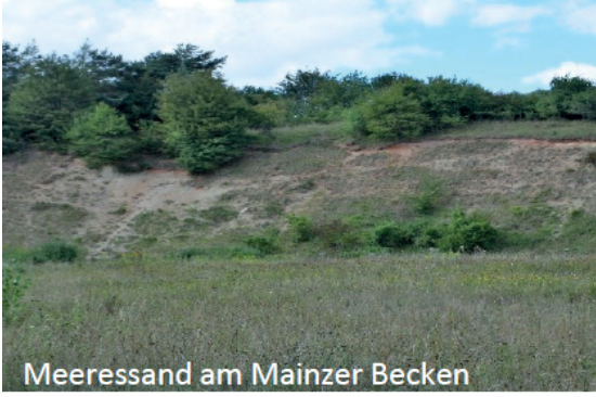
Meeressand am Mainzer Becken