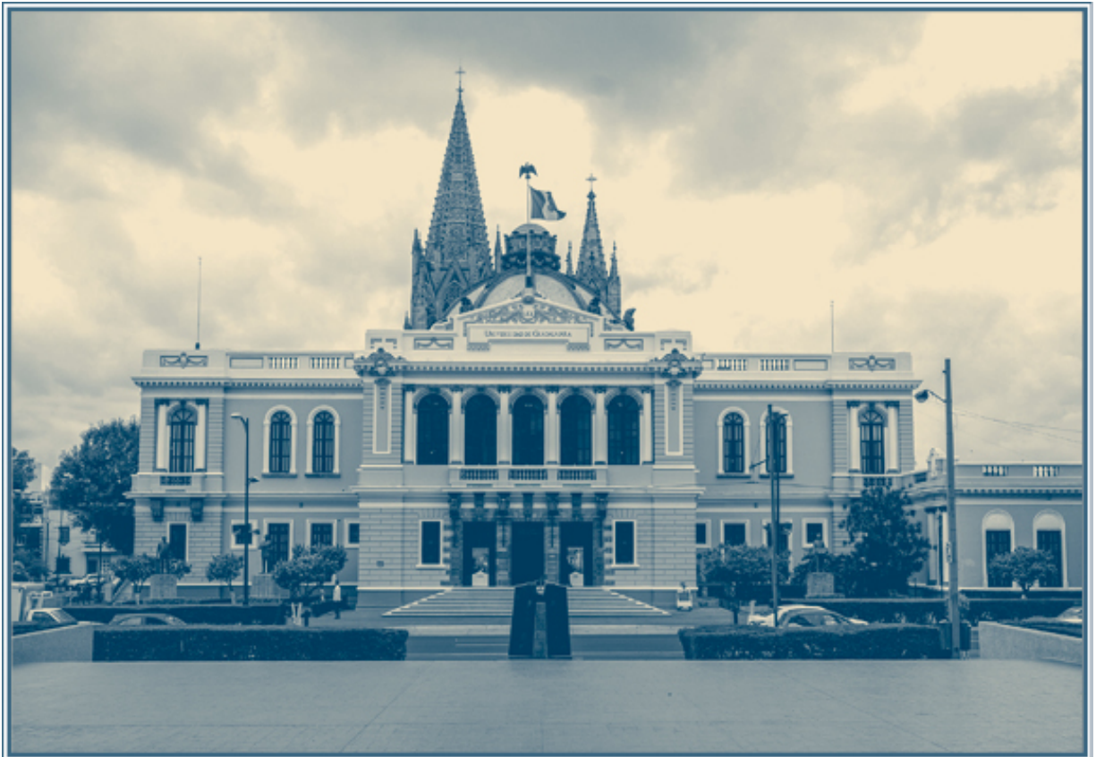
Imagen del Paraninfo de la Universidad de Guadalajara, tomada desde la explanada del edificio de la Rectoría General.