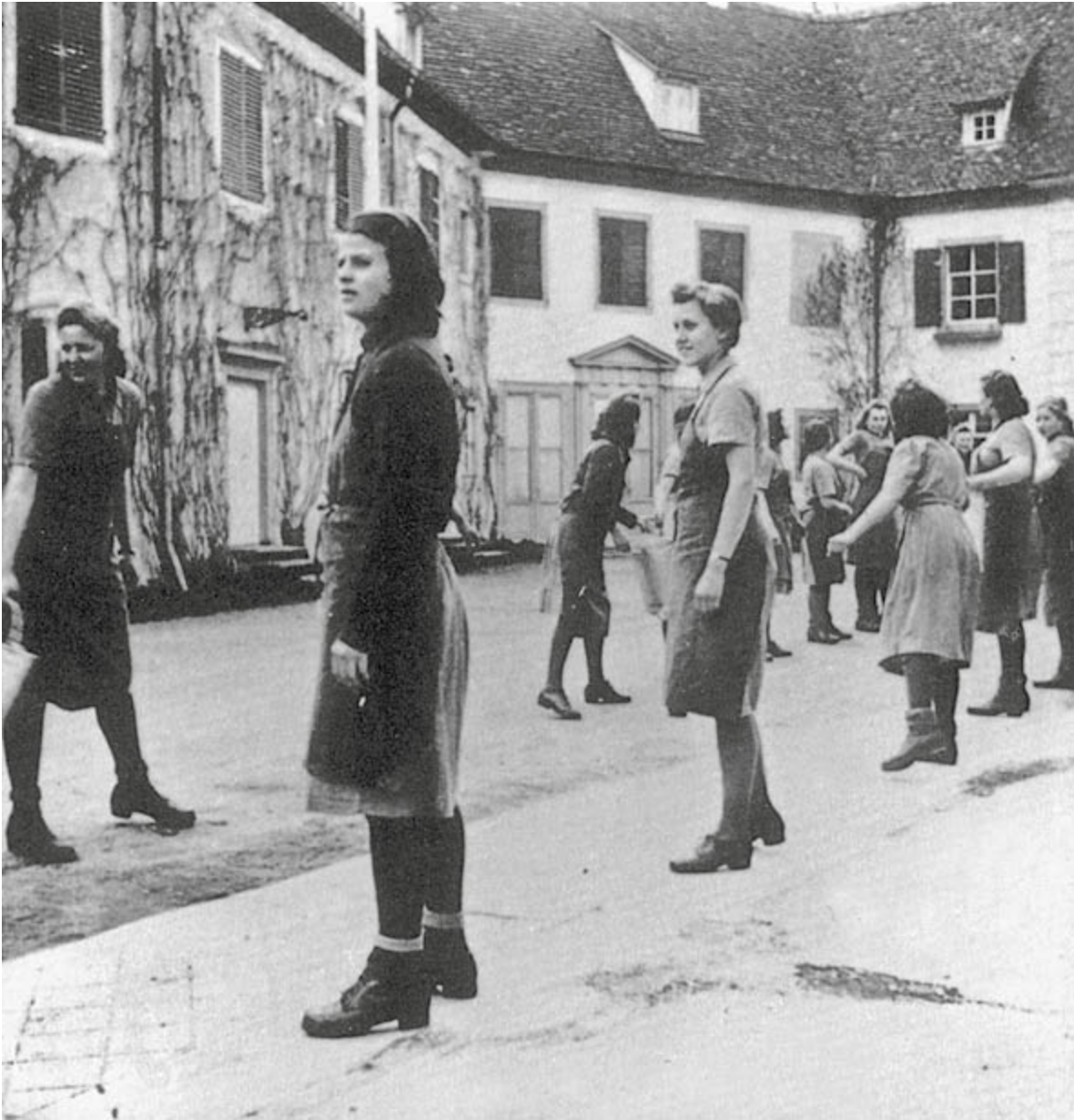
Sophie Scholl (2. v. li.) im Reichsarbeitsdienst, Krauchenwies, Frühjah 1941

Selbst Sophie gelang es nicht, sich auf Dauer abzuschotten. Nach ein paar Wochen schrieb sie nach Hause, sie habe sich von dem nettesten Mädchen aus ihrem Schlaflsaal eine Taschenlampe geliehen, um unter der Bettdecke länger lesen zu können. Auch in der Küche fand sie bald Verbündete, «die mir ab u. zu etwas zukommen lassen».[10] In den Briefen an die Eltern stellte sie die Zeit in Krauchenwies als Herausforderung dar, die sie zu meistern