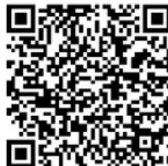
Avenza para iOS

Un cop instal·lada PDF Maps, podràs carregar-hi el mapa de Venècia dissenyat per Alhena des de l'adreça següent (el