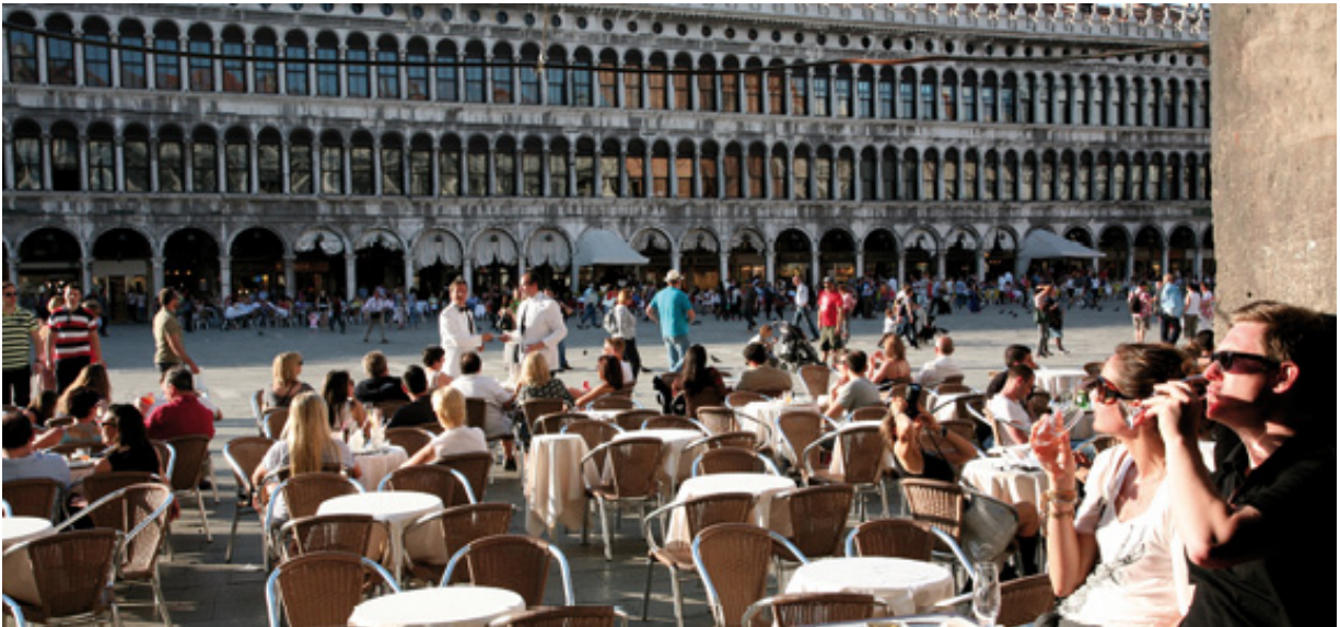
Cafeteria a la Piazza San Marco.

Encara que a primera vista els venecians poden semblar freds i distants, són gent que resulta molt amable i hospitalària, disposada a atendre'ns en qualsevol moment. Com és lògic, en una ciutat envaïda constantment per turistes, qui no viu d'aquesta indústria està una mica fart de tanta gent. Una altra qüestió, que també els fa semblar distants, és el dialecte que parlen entre ells i que resulta incomprendible per a la resta. Els venecians estan encantats amb la seva ciutat i, tot i que puguin ser molt crítics, no consenten que ho siguin els que la visiten.