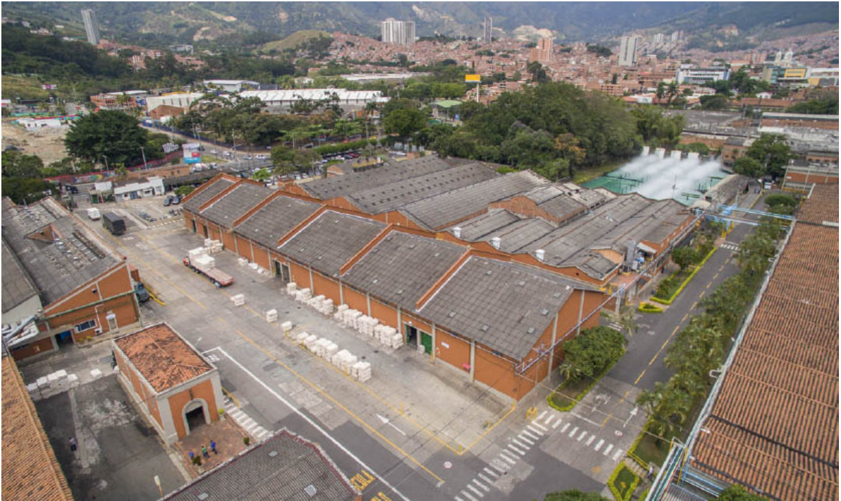
Fabricato S. A., Bello (Antioquia), 2019

Fabricato. Muchos testimonios dan cuenta de ello a lo largo de su historia, como la construcción en Bello del barrio Obrero, la clínica, la escuela, la biblioteca y tantos otros espacios que beneficiaron a cientos de personas. Súmense los aportes a la promoción de la música, la fotografía y otras artes.