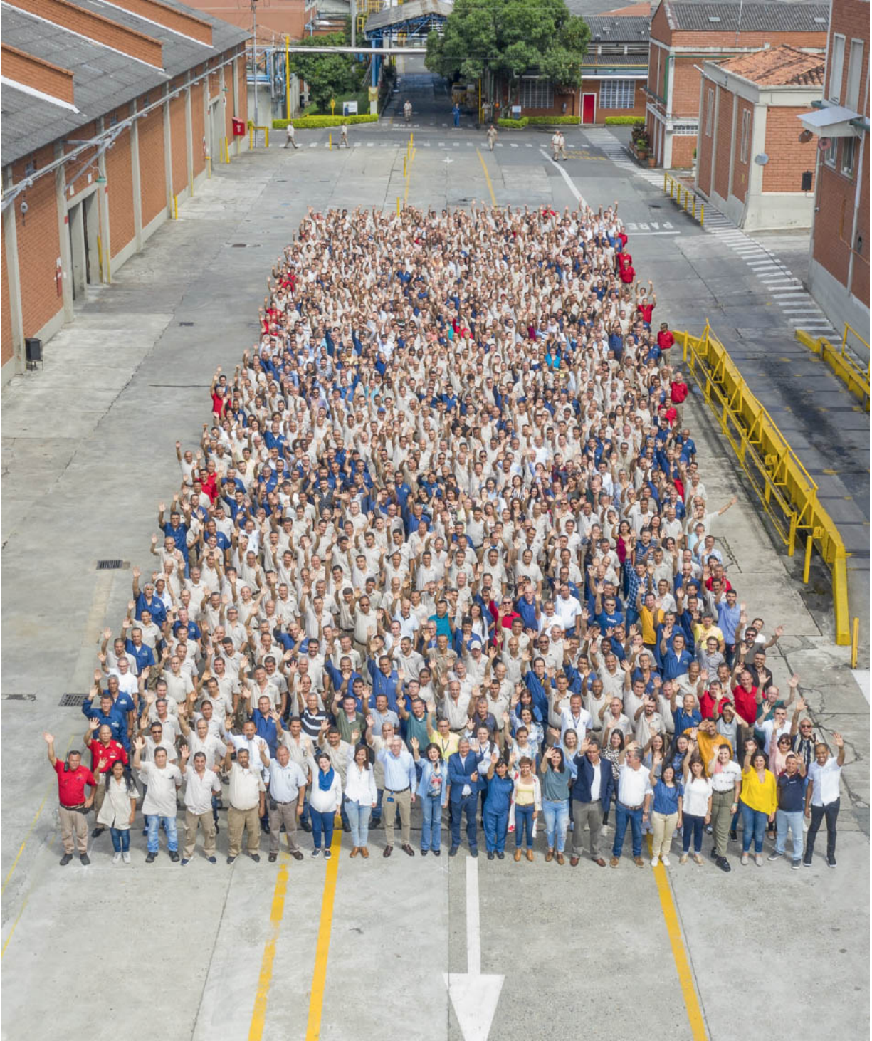
Personal de Fabricato S. A.