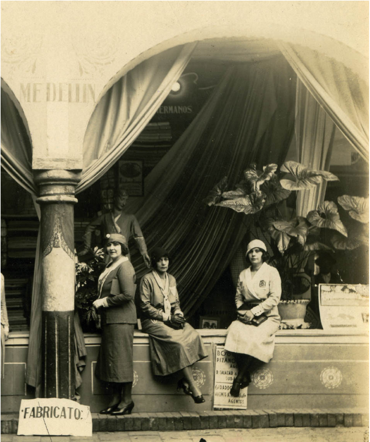
[Detalle] Pabellón de Fabricato en la Gran Exposición Nacional de Bogotá, 1931