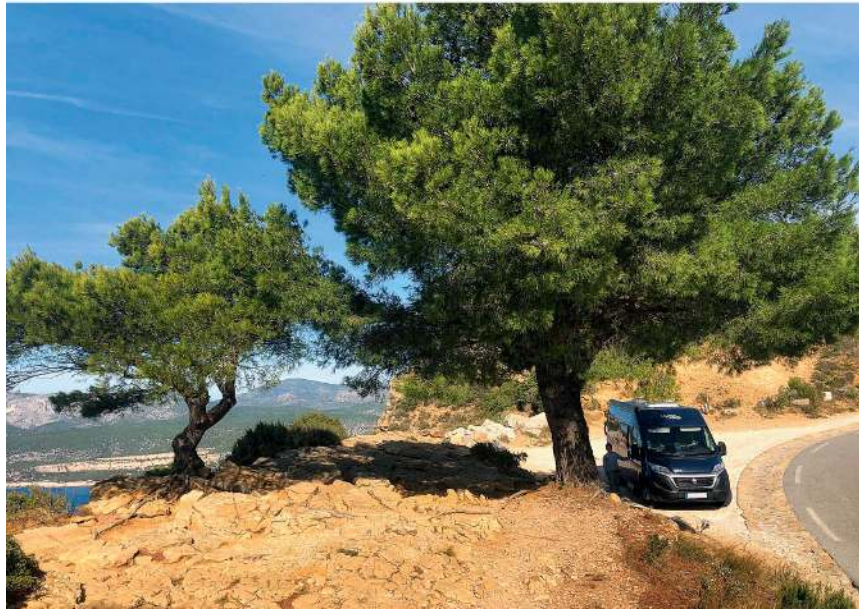
Oben: Abendessen am Campervan nach einem Badetag Unten: Mittagspause mit Weitblick an der provencalischen Küste