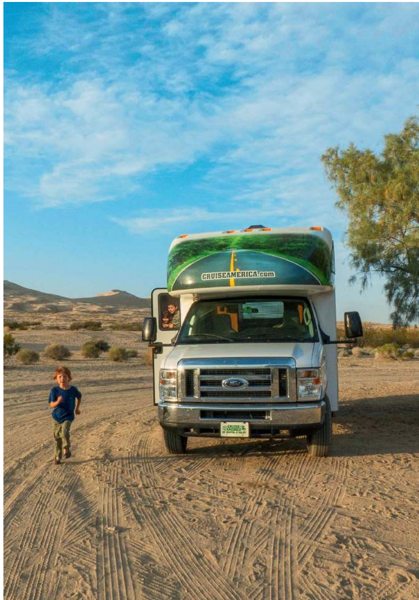
Eine Nacht mitten in der Wüste verbringen und trotzdem keinen Komfort vermissen: Wohnmobilreisen machen es möglich.