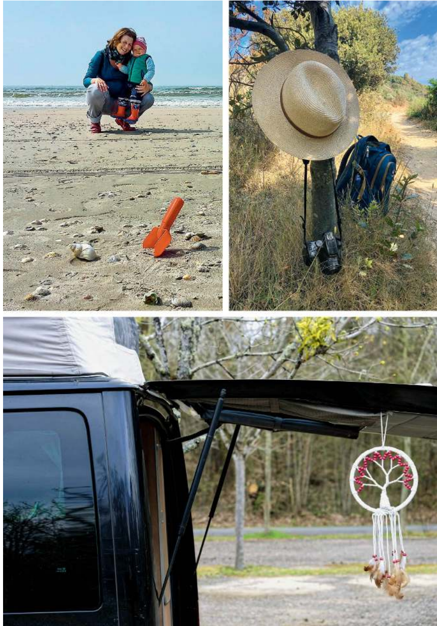
Sandschippe, Rucksack, Sonnenhut und Kamera: wichtige Utensilien für eine Traumreise im Wohn mobil mit Kindern