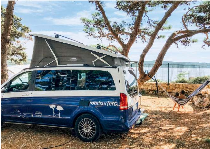
Oben: Kuscheltier an Bord? Dann kann es losgehen. Unten: Geschwisterliebe - eine Hängematte für alle