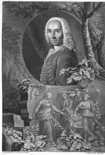
Abbildung 2: Johann Jakob Bodmer , Stich von Johann Jakob Haid nach einem Gemälde von Johann Caspar Füssli

Wie für jeden Gelehrten des 18. Jahrhunderts gehörte Briefeschreiben zu Sulzers und Bodmers Alltag. Beide lebten im ›Jahrhundert des Briefes‹ und in einer Zeit, in der die wohl bedeutsamste Transformation epistolaren Schreibens stattfand, die nicht zuletzt mit einer quantitativen Vervielfachung und qualitativen Perfektionierung des Mediums einherging. 11 Tatsächlich wussten Bodmer und Sulzer die Gattung Brief in nahezu all ihren Facetten und Möglichkeiten zu nutzen: als privaten, distanzüberbrückenden Gebrauchstext, Mitteilungsträger, Informations- und Wissensspeicher, Materialdepot (etwa für Rezensionen) aber auch und besonders als Medien des intimen Austausches und der kritischen Reflexion. 12 Es ging darum, sich gegenseitig über Arbeiten und Publikationen, über