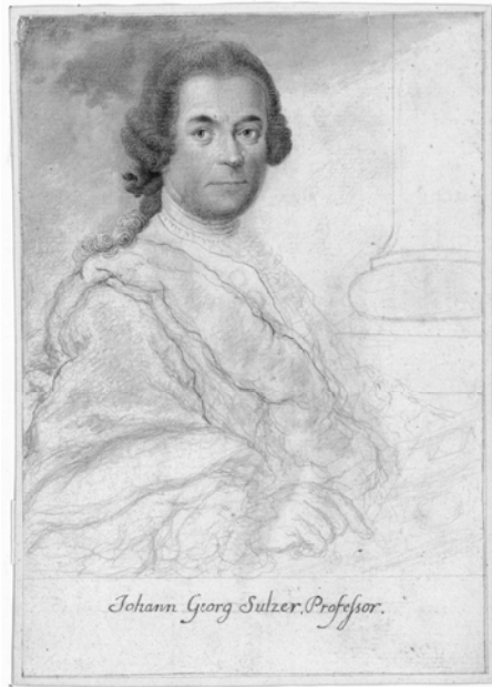
Abbildung 1: Johann Georg Sulzer, Zeichnung von Johann Caspar Füssli, 1762/1763

Freundschaft, auch weil Klopstock nicht «derjenige gewesen» war, für den er ihn «aus seinen briefen erkennen mußte», wie Bodmer resignierend in einem Brief an Sulzer feststellte. 10 Briefwelt und Realität lagen zu weit auseinander. Mit 475 Erwähnungen gehört Klopstock dennoch unangefochten zu den prominentesten Figuren des Briefwechsels und auch Wieland blieb über die Jahre hinweg darin überaus präsent.