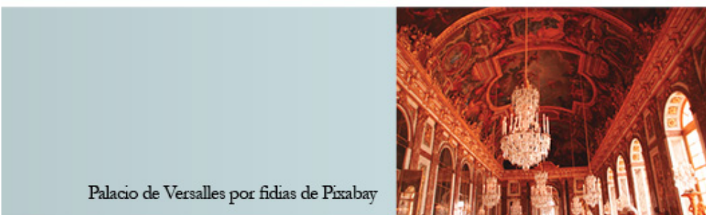
Palacio de Versailles

El palacio, a mi parecer, más majestuoso de la humanidad cuenta con 700 estancias, 2.513 ventanas, 352 chimeneas (1.252 durante el Antiguo Régimen), 67 escaleras y 483 espejos repartidos en la Gran Galería, Salón de la Guerra y Salón de la Paz. La superficie total es de 67.121 m 2 , de los cuales 50.000 están abiertos al público.