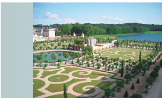
Jardines de Versailles

Para demostrarlo, voy a hacer una comparación con el rey Luis XIV de Francia, el que construyó el Palacio de Versalles (en francés, Château de Versailles).