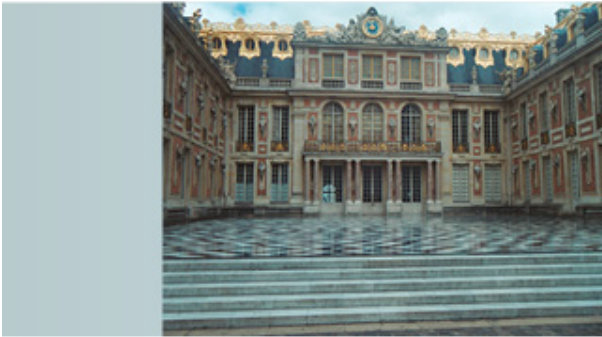
Palacio de Versailles

hectáreas y el Trianón, 50. Tiene 20 km 2 de vallas y 42 km 2 de paseos con 372 estatuas.