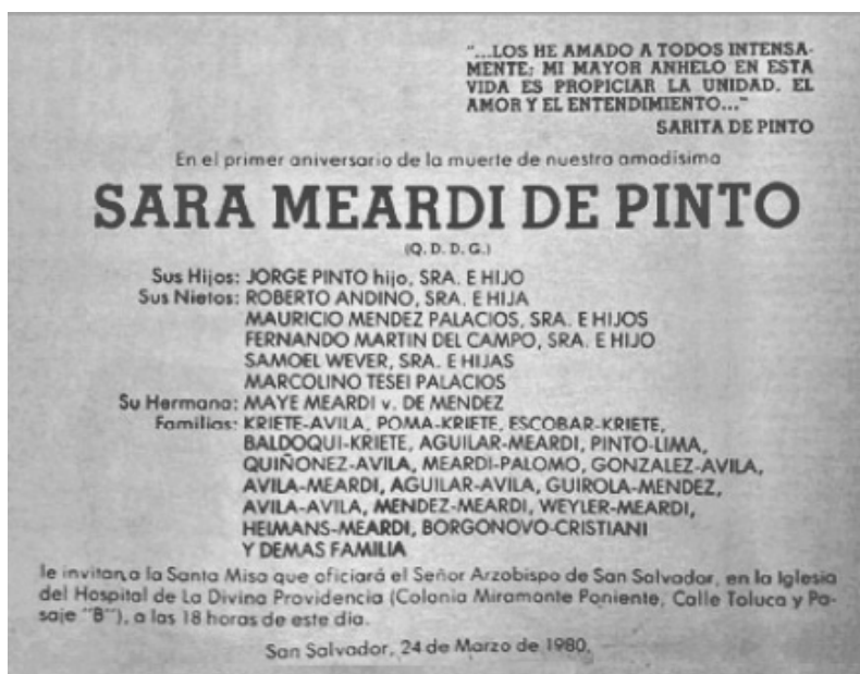
ilustración 3. Aviso que fue publicado en los rotativos más importantes. Allí se anuncia que el arzobispo oficiará la misa. Ante tal imprevisión (¿o premeditación?), colaboradores cercanos sugirieron a Romero que no se presentara, pues el anuncio lo había dejado claramente expuesto. ¡Y tuvieron razón! Esa misa se transformó en la ocasión perfecta para ejecutar la venganza de “los dioses del poder y del dinero” con quien “hablaba mucho”, al decir de ellos. Y en verdad, el día anterior, domingo 23 de marzo de 1980, había hablado demasiado.

Ahora se sabe que “Él cambió las lecturas; tocaban las lecturas de la mujer adúltera y de la casta Susana...”. 23 Pero no sólo eso trocó. Además, se permitió introducir “esa página” (según sus propias palabras) “que he escogido para ella [la difunta] del Concilio Vaticano”. 24 Así lo justificó ante los pocos orantes “en una misa de tono familiar”.