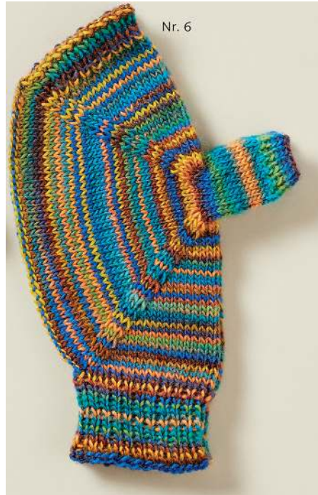
Herrengröße oder bequeme Damengröße (20 Maschen)