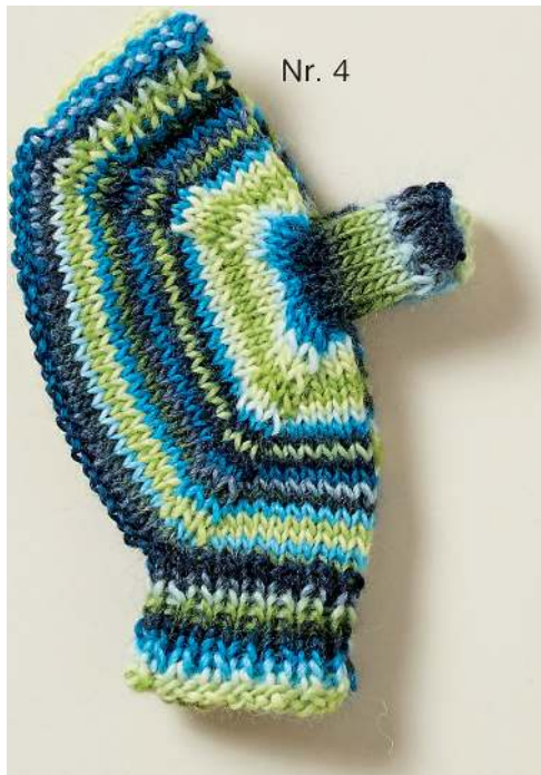
Kindergröße (12 Maschen)