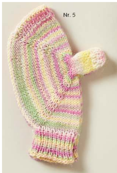
Damengröße (16 Maschen)