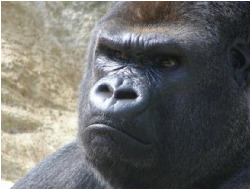
Wütender Gorilla

fingen sie an, ein bisschen Lärm zu machen. So wurde der große Gorilla alarmiert. Er war wirklich sehr groß und sehr breit. Er beobachtete uns zunächst ganz ruhig, ohne sich zu bewegen. Wir versuchten dann einfach weiterzugehen, nicht weit entfernt von ihnen. Dann ging der große Gorilla von der Gruppe weg und kam in unsere Richtung. Wir bekamen Angst, waren aber auch neugierig. Wie am Boden festgenagelt standen wir da und es wurde immer bedrohlicher. Wir waren so klein, die älteste unter uns war meine Schwester. Sie war nicht einmal 8 oder 9. Dieser riesige Gorilla war der Chef des Rudels. Er fing an, kleine Bäume und Äste zu schütteln. Wir standen immer noch da, wie hypnotisiert. Dann rannte er springend hin und her. Wir konnten vor Angst zuerst nicht fliehen. Das ärgerte ihn noch mehr und er näherte sich uns.