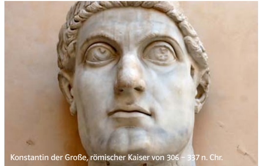
Konstantin der Große, römischer Kaiser von 306 – 337 n. Chr.

Die Römer in Deutschland! Im 4. Jahrhundert n. Chr. war Trier Residenzstadt des römischen Kaisers Konstantin.