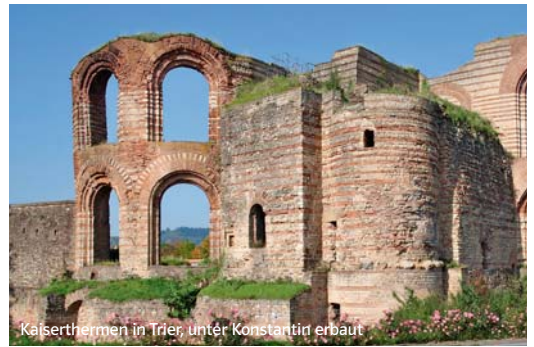
Kaiserthermen in Trier, unter Konstantin erbaut

Hinweis: Die Komposita von esse werden wie das Simplex konjugiert.