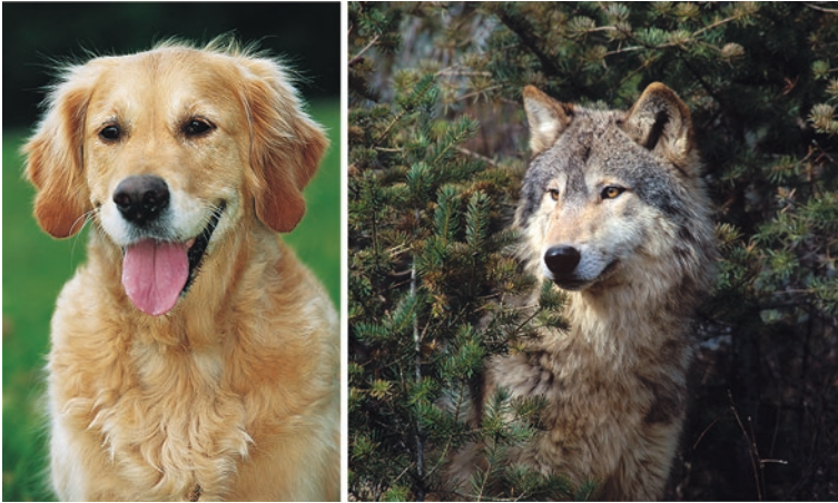
Abb. 2.1 Eindeutig erwiesen: Hund und Wolf haben einen gemeinsamen Vorfahren

Wichtig für uns ist im Folgenden, zwischen dem Stammvater Wolf und dem heutigen Wolf zu unterscheiden. Denn der heutige Wolf ist nicht der direkte Vorfahre unseres Hundes, sondern sein Cousin. Hund und heutiger Wolf stammen also von einem gemeinsamen Vorfahren ab, so wie Cousin und Cousine gemeinsame Großeltern haben. Wenn wir die Unterschiede zwischen Hund und Wolf betrachten, müssen wir das bedenken: Wir können die Hunde in unseren Studien heute nicht mit dem Stammvater, dem „Urwolf“ vergleichen, sondern nur mit seinem heute lebenden Cousin. Und auch dieser hat sich natürlich in den letzten 40.000 Jahren weiterentwickelt. Z. B. wurde der Wolf an vielen Stellen der Welt intensiv bejagt. Man kann sich also vorstellen, dass nur die scheuesten Wölfe überlebt und sich fortgepflanzt haben. Bei den Hunden wiederum haben sich diejenigen durchgesetzt, die besonders gut mit Menschen zurechtkamen.