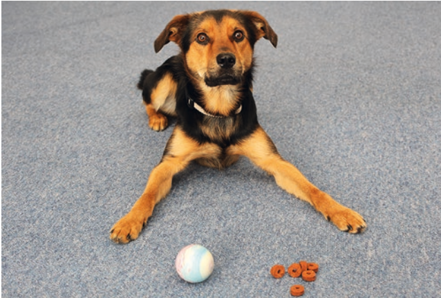
Abb. 1.2 Beides kann den Hund motivieren: Spielzeug ebenso wie Futter

Hundebesitzer erzählen uns immer wieder, dass ihre Zöglinge auf dem Weg in den Park selbstständig zu den Hunde-Testräumen abbiegen. Eine neue Studie scheint also besser zu sein als ein bekannter Spaziergang. In den Testräumen erleben die Hunde Spiel, Suche nach Futter und – wenn gewünscht – Kontakt mit Artgenossen. Und vor allem gibt es dort einen Menschen, der sich nur mit ihnen beschäftigt.