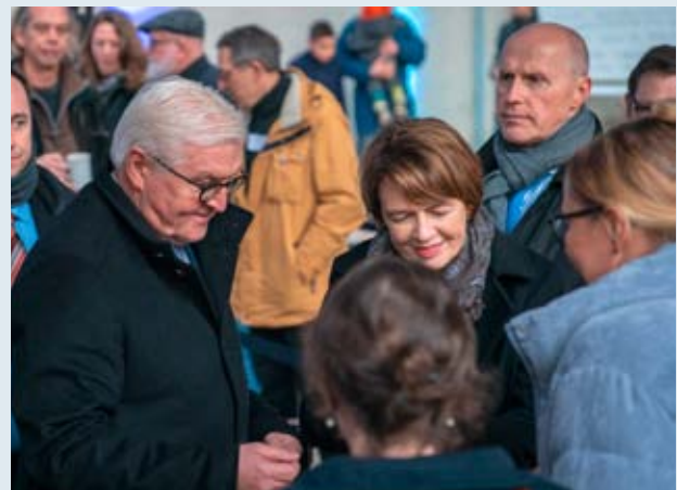
Bundespräsident Frank-Walter Steinmeier und Elke Büdenbender beim Dialogischen Spaziergang am Werkstatttag „Demokratie im Quartier“ im Februar 2019

Der Tagestreff und Begegnungsraum Die Brücke für Bedürftige liegt in direkter Nachbarschaft zu den von der UNS reaktivierten und mit Leben gefüllten Räumen und öffnet schon seit mehr als 15 Jahren regelmäßig seine Türen. Als die UNS ihr Engagement begann, wurde Anfang 2015 mit Ehrenamtlichen, Bedürftigen und Aktiven eine Zukunftswerkstatt durchgeführt, um eine eigene Vision für die „neue Nachbarschaft“ zu entwickeln.