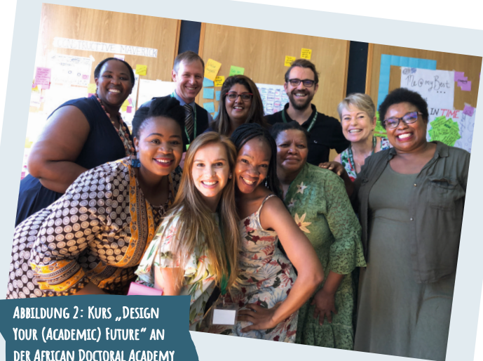
ABBILDUNG 2: KURS „DESIGN YOUR (ACADEMIC) FUTURE“ AN DER AFRICAN DOCTORAL ACADEMY

Wertschätzung und Neugierde begegnet und ihr Team hat ihr zugesprochen, dass es eine tolle Vision sei. Sie haben sie darum gebeten, ihnen mehr davon zu erzählen und ihnen zu erzählen, was sie genau daran interessiere. Sie erzählte, dass das Fallschirmspringen für sie Freiheit bedeuten würde, dass ihr allein der Gedanke daran einen herrlichen Nervenkitzel bereite und