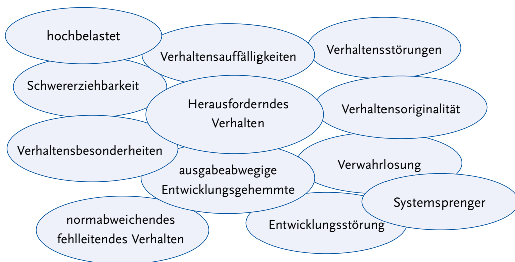
Abbildung 2: Verschiedene Bezeichnungen für herausforderndes Verhalten

Neben diesen kritisch zu betrachtenden Begrifflichkeiten existieren Begriffe, wie Verhaltensbesonderheiten oder Verhaltensoriginalität. Beide Begriffe entstammen dem Wunsch, Kinder mit auffälligen, störenden und herausfordernden Verhaltensweisen nicht als „in sich falsch“ zu stigmatisieren. Doch werden auch diese Begriffe der Notlage des Kindes und dem Anteil der materiellen und personalen Umwelt daran, den Veränderungsmöglichkeiten und der Notwendigkeit eines achtsamen, ernsthaften und fürsorglichen Umgangs durch die erwachsenen Begleitpersonen, nicht gerecht.