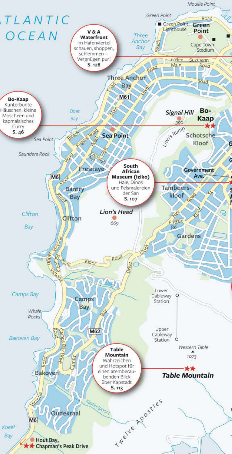
Table Mountain Wahrzeichen und Hotspot für einen atemberaubenden Blick über Kapstadt S. 113

South African Museum (Iziko) Haie, Dinos und Felsmalereien der San S. 107