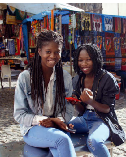
OBEN: Bo-Kaaps Häuser, bunt wie Bonbonnieren UNTEN LINKS: Gut gelaunt am Greenmarket chatten UNTEN RECHTS: Proteen sind Fynbos-Weltherbe.