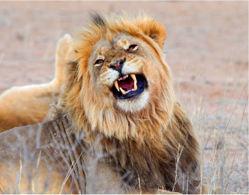
OBEN: Besser nicht stören ... UNTEN: Der Sunbird liebt den süßen Nektar der Königsprotea.