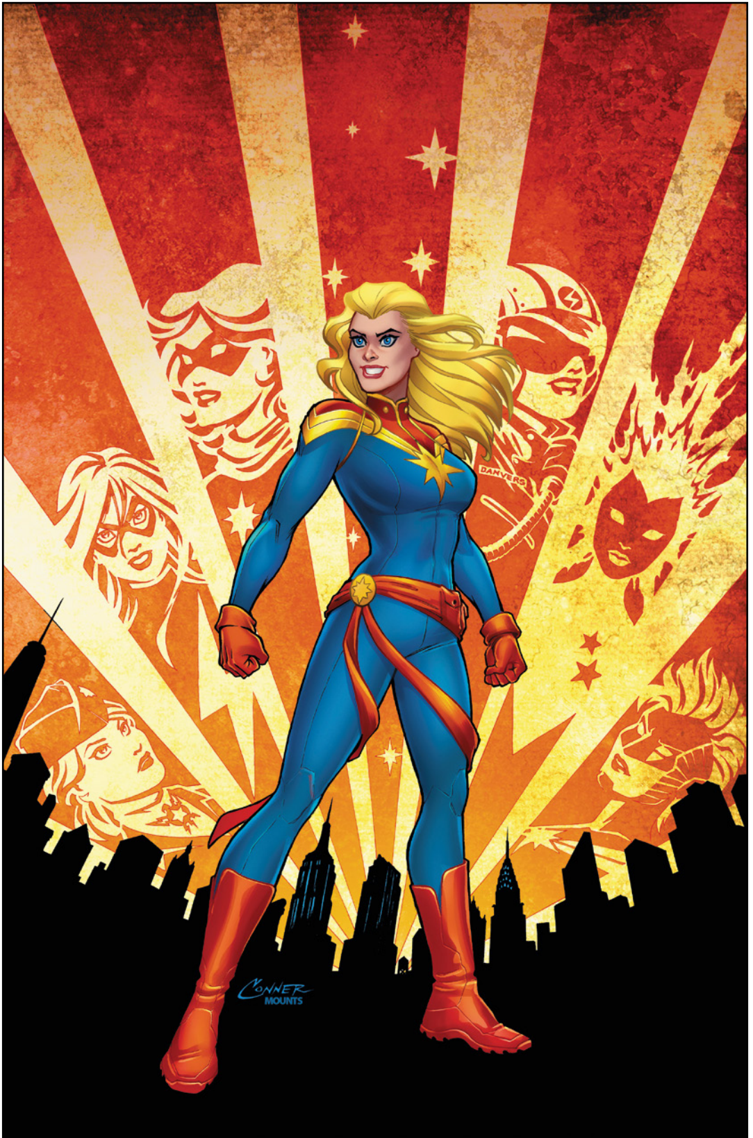
Captain Marvel (2019) 1 Cover von AMANDA CONNER