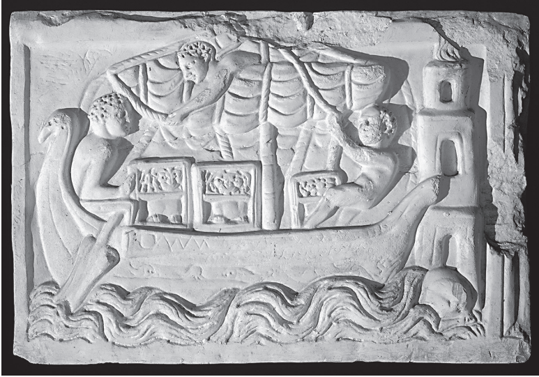
ABB. P.1 In Käfigen eingesperrte Löwen auf einem Schiff, römisches Relief, drittes Jahrhundert

Seine berühmten Worte lauten: «Aber das Sinken Roms war die natürliche und unvermeidliche Wirkung übermäßiger Größe. Das Glück brachte den Keim des Verfalles zur Reife, die Ursachen der Zerstörung vervielfältigten sich mit der Ausdehnung der Eroberungen, und sobald Zeit oder Zufall die künstlichen Stützen entfernt hatten, gab der riesenhafte Bau dem Drucke seines eigenen Gewichtes nach.» Der Untergang Roms war nur ein Beispiel für die Vergänglichkeit aller menschlichen Werke. Sic transit gloria mundi. 7