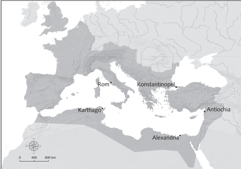
KARTE 1 Das Römische Reich mit seinen größten Städten im vierten Jahrhundert

Und das war keine dichterische Phantasie. Zur Zeit Claudians gab es stolze Römer von Syrien bis Spanien, von den sandigen Wüsten Oberägyptens bis zu den frostigen Grenzen Nordenglands. Nur wenige Reiche in der Geschichte erreichten sowohl die geographische Ausdehnung als auch die Integrationskraft des römischen Commonwealth. Keines verband Größe und Einheit wie das römische, keines hatte so lange Bestand. Kein anderes Reich konnte auf so viele Jahrhunderte ununterbrochener Größe zurückblicken, die überall zutage trat, wenn man sich auf dem Forum umschaute.