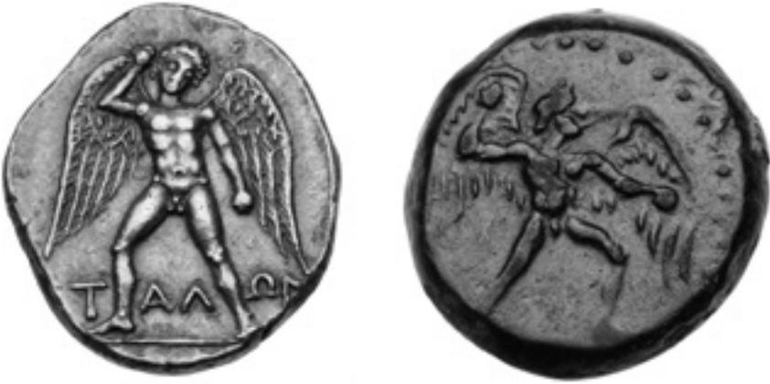
Abb. 1.2: Der Steine werfende Talos auf Münzen aus Phaistos, Kreta. Links: Silberstater, 4. Jh. v. Chr. (auf der Rückseite: ein Stier). Rechts: Talos im Profil; Bronzemünze, 3. Jh. v. Chr. (auf der Rückseite: der goldene Hund).

helfen uns, unser Talos-Bild zu vervollständigen, und manche künstlerischen Darstellungen von ihm enthalten sogar Details, die in der überlieferten Literatur fehlen. 13 Die Silbermünzen der Stadt Phaistos – ursprünglich eine der drei großen minoischen Städte des bronzezeitlichen Kretas – aus der Zeit von ca. 350 bis 280 v. Chr. sind Beispiele dafür. Sie zeigen einen bedrohlichen Talos von vorn oder im Profil, wie er Steine wirft. Keine einzige Quelle aus der Antike besagt, dass er Flügel gehabt hätte oder geflogen sei, doch auf den Münzen aus Phaistos hat Talos tatsächlich Flügel. Sie könnten ein Symbol für seinen nicht-menschlichen Status sein oder auf seine übermenschliche Geschwindigkeit anspielen, wenn er die Insel umrundete (nach einigen Berechnungen habe er sich mit mehr als 250 km/h fortbewegt). Auf der Rückseite einiger dieser Münzen aus Phaistos wird Talos von dem goldenen Hund Lailaps begleitet, einem der drei Ingenieurswunderwerke, die Hephaistos für König Minos geschaffen hat. Der Wunderhund hat wiederum seinen eigenen antiken Überlieferungsfundus (siehe Kapitel 7).