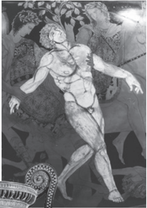
Abb. 1.4: Der Tod des Talos: Detail der Ruvo-Vase.