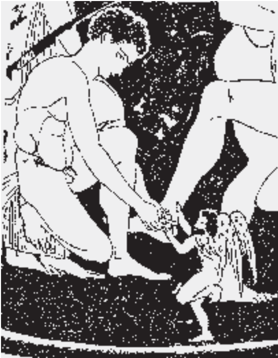
Abb. 1.6: Detail des Monte-sarchio-Kraters: Iason benutzt ein Werkzeug, um den Stift aus Talos' Fessel zu entfernen.

nen runden Stift in Talos' Fessel hantiert. Medea, die sich über Iason beugt, hält ihre Schale mit Drogen. Eine kleine geflügelte Thanatos-Gestalt hält und stützt Talos' Fuß. Diese Todesgestalt, auf einem Fuß stehend, den anderen zurückgebeugt, scheint Talos' Todeskampf zu symbolisieren.