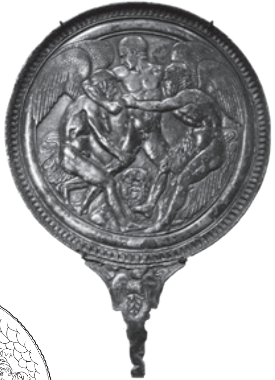
Abb. 1.7: Unten: Talos zerquetscht Kastor und Polydeukes an seiner Brust, während eine Frau eine Kiste öffnet und zu Talos' Fessel greift; etruskischer Bronzespiegel, ca. 460 v. Chr. Oben: Talos zerquetscht zwei Männer; etruskischer Bronzespiegel.