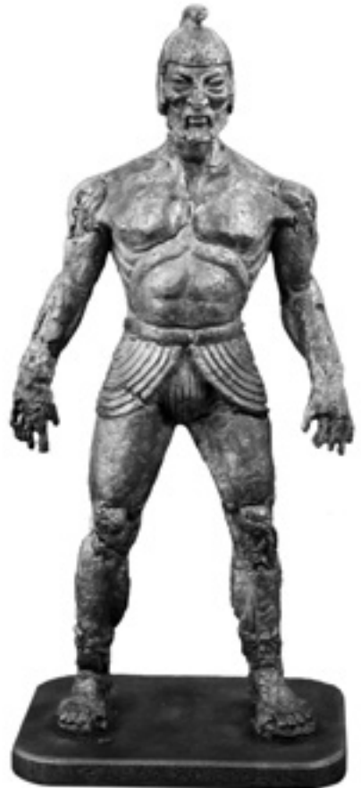
Abb. 1.1: Talos; Bronzeabguss des bröckeligen Originalmodells von Ray Harryhausen aus dem Film Jason und die Argonauten (1963).

Als er sein Epos Argonautika im 3. Jh. v. Chr. schrieb, bezog sich Apollonios auf viel ältere, mündlich und schriftlich überlieferte Versionen der Mythen um Jason, seine spätere Ehefrau, die Hexe Medea, und Talos. Diese Geschichten waren seinem Publikum bereits sehr vertraut. Apollonios schrieb in einem archaischen, also einem bewusst altertümlich anmutenden Stil. Er stellt Talos an einer Stelle als Überlebenden oder Relikt des „Zeitalters der bronzenen Menschen“ dar – eine raffinierte, hochnäsige Anspielung auf einen symbolischen Abschnitt in Hesiods (ca. 750–650 v. Chr.) Lehrgedicht Werke und Tage über die lang zurückliegende Vergangenheit der Bronzezeit. 4 In den