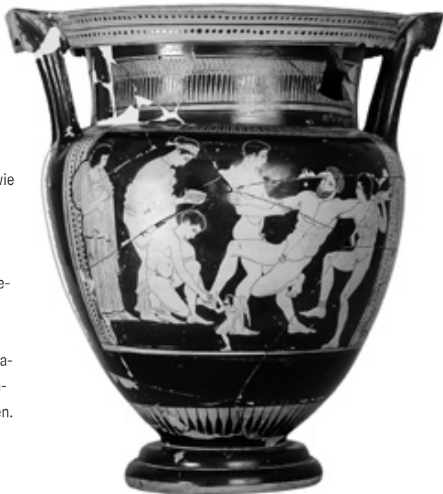
Abb. 1.5: Medea schaut zu, wie Iason mit einem Werkzeug den Stift aus Talos’ Fessel löst, die von einer kleinen, geflügelten Todesgestalt gehalten wird; Talos sinkt in die Arme von Kastor und Polydeukes; rotfiguriger Krater, 450–400 v. Chr., gefunden in Montesarchio, Italien.

Ein früheres Vasenbild (440–430 v. Chr.) auf einem attischen Krater aus Süditalien zeigt Talos als große, bärtige Gestalt mit Gleichgewichtsproblemen, wie er gegen Kastor und Polydeukes kämpft (Abb. 1.5 und 1.6). Diese Szene weist zudem einige auffällige Details auf, die den technologischen Charakter von Talos’ Vivisystem und dessen Zerstörung bestätigen: Wir sehen, wie Iason neben dem rechten Fuß des Roboters kniet und mit einem Werkzeug an dem klei-