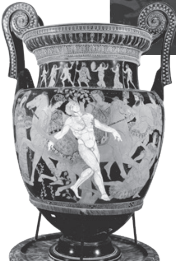
Abb. 1.3: Der Tod des Talos: Der metallene Roboter Talos sinkt ohnmächtig in die Arme von Kastor und Polydeukes, wäh- rend Medea eine Schale mit Drogen hält und boshaft drein- blickt; rotfiguriger Volutenkrater des sogenannten Talos-Malers, 5. Jh. v. Chr., aus Ruvo, Italien.