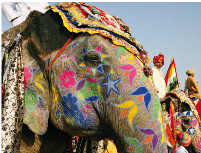
Elefantenfest in Jaipur, Rajasthan

Darjeeling Umwerfende Ausblicke auf den Kanchenjunga, den dritthöchsten Berg der Erde, in der Ferne, ein uriges britisch-indisches Flair und die berühmte Fahrt mit dem „Toy Train“ von der Ebene hinauf zur Stadt machen den Reiz des indischen Teezentrums aus. S. 663