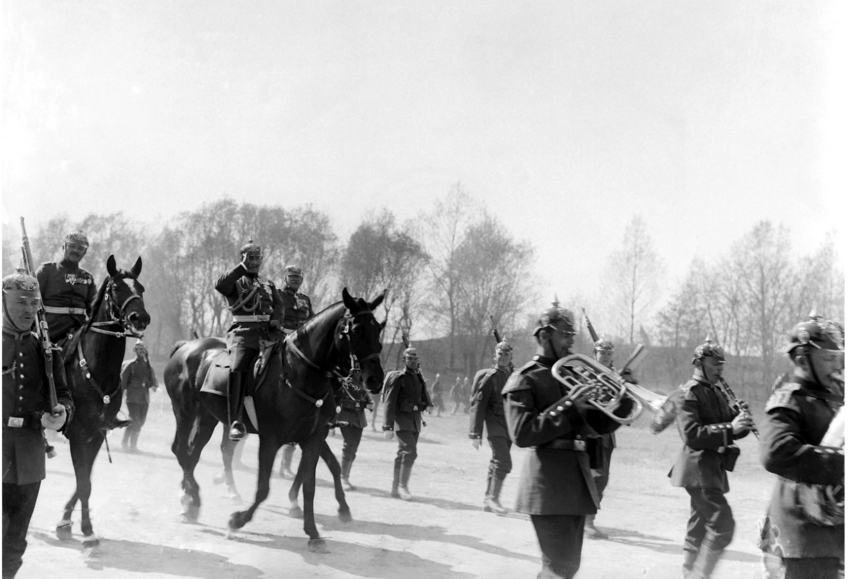
Kaiser Wilhelm II. in Metz, um 1895. Die Stadt im »Reichsland Elsass-Lothringen« ist 25 Jahre nach Ende des Krieges die größte Garnison im Deutschen Reich. Wilhelm II. nimmt besonders gerne an den jährlichen großen Manövern in ihrer Umgebung teil.

im neuen »Reichsland Elsass-Lothringen« und wurde damit Teil des neuen Deutschen Kaiserreichs. Foch und seine Mitschüler verließen die Stadt, die nun für 47 Jahre zu Deutschland gehören würde.