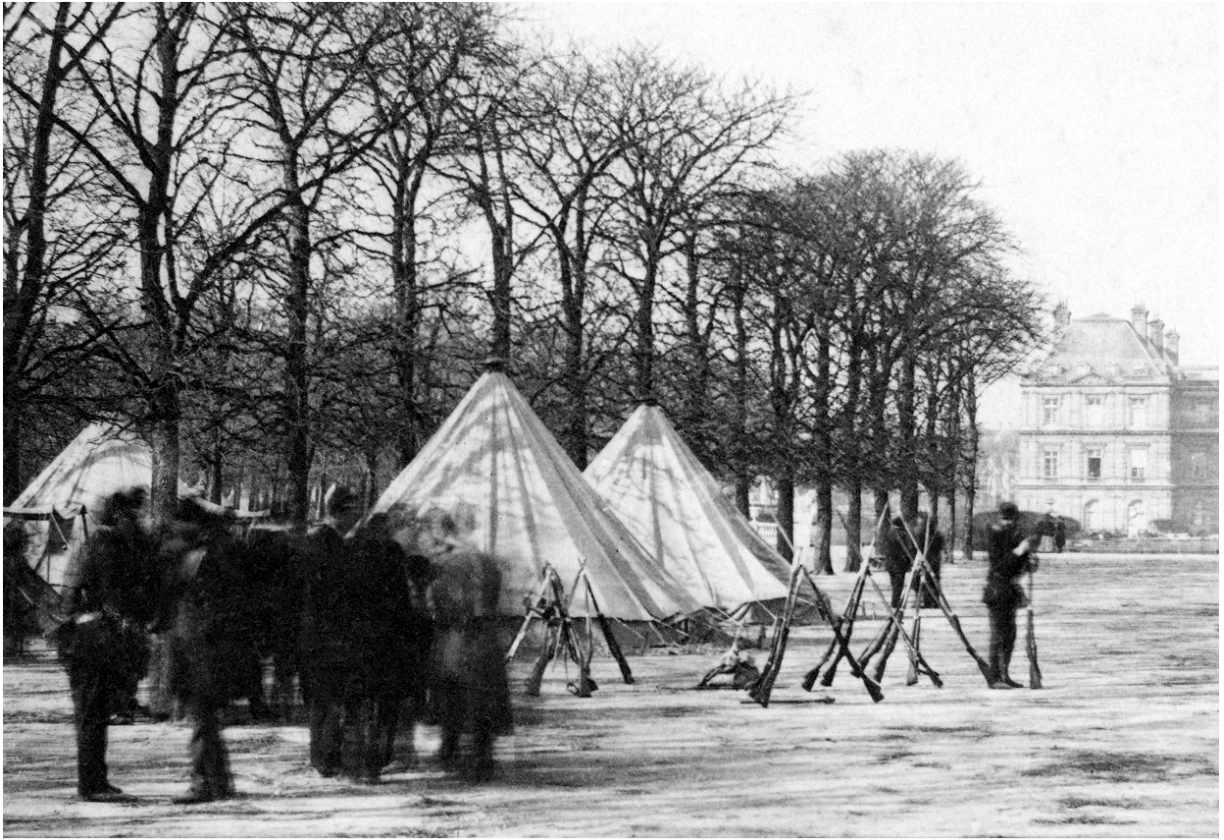
Ein Biwak der französischen Armee im Jardin du Luxembourg in Paris während des Aufstandes der Pariser Commune. Aus den sechs Wochen Pariser Commune gibt es weit mehr Fotografien als von der vier Monate währenden Belagerung von Paris.

den Tod befohlen. 1925 wählen ihn die Deutschen zu ihrem Reichspräsidenten. 1933 lässt er zu, dass Adolf Hitler sich die Macht erschleicht.