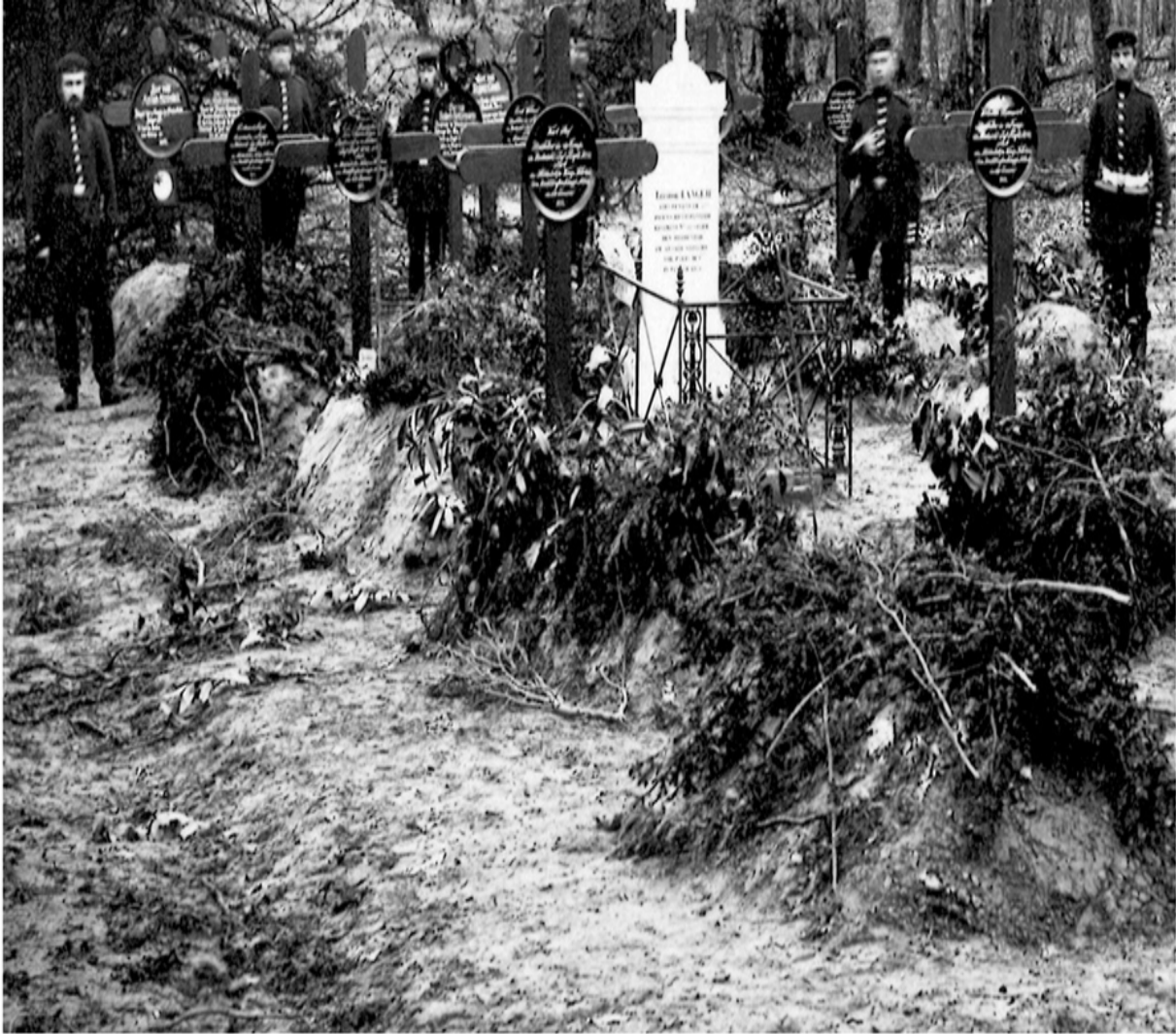
Der Friedhof im Schlosspark von Saint-Cloud bei Paris, für Angehörige des preußischen V. Armeekorps (Provinz Posen) und der Garde-Landwehr-Division, die bei der Schlacht von Buzenval am 19. Januar 1871 gefallen sind. Aufnahme vom 4. Februar 1871.