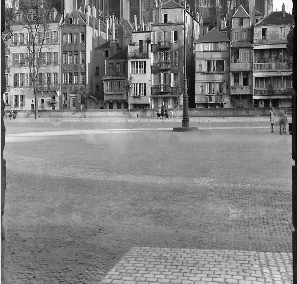
Die Metzzer Kathedrale Saint-Étienne. Von vielen Beobachtungspunkten können die preußischen Soldaten in den 68 Tagen der Belagerung der Rheinarmee in der Festungsstadt die Türme des gotischen Gotteshauses sehen. Aufnahme aus dem Jahr 1892.