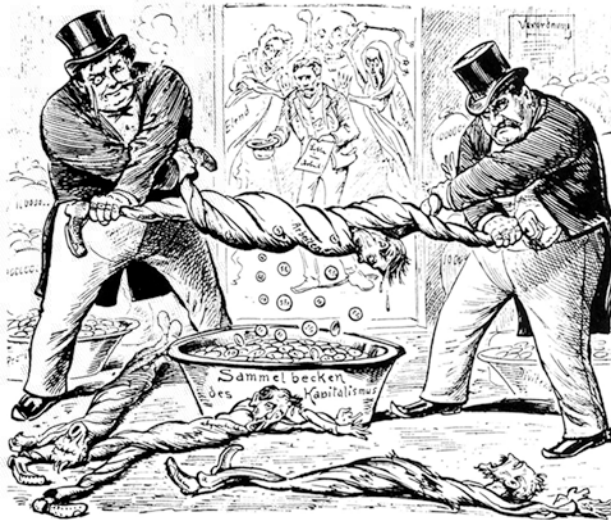
Abb. 2.3 Das neue Verhältnis zwischen Arbeiter und Unternehmer. Karikatur aus dem Neuen Postillon, Zürich 1896.

sen. Die Arbeiter erzeugen die Produkte durch ihre Arbeitskraft, jedoch erhalten sie vom Kapitalisten nur so viel als Anteil am Produkt, wie sie zum Leben und zum Erhalt ihrer Arbeitskraft benötigen – ihr Lohn ist ein Existenzminimum. Die Differenz zwischen dem durch die Arbeit neugeschaffenen Wert und dem Wert der Arbeitskraft bezeichnet Marx als „ Mehrwert “, der dem Kapitalisten zufließt (siehe Abb. 2.2).