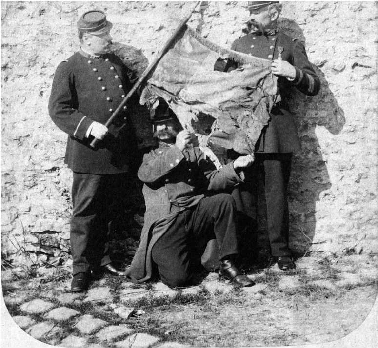
6. August 1870, nach der Schlacht bei Wörth: Französische Soldaten präsentieren ihre Regimentsfahne.