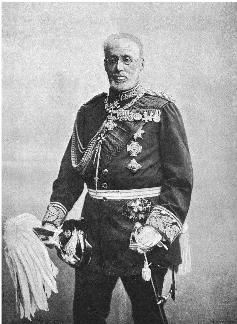
Erzherzog Albrecht von Österreich-Teschen in preußischer Marschall-Uniform, (Foto 1895).