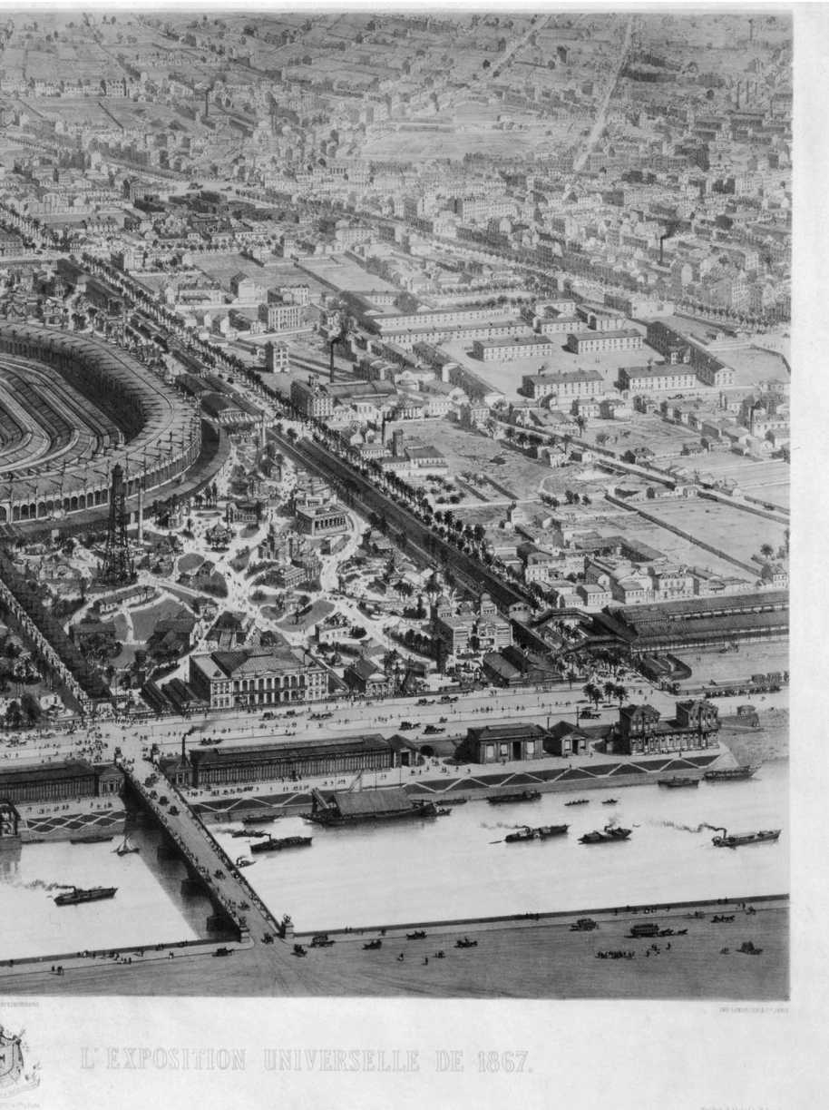
»Vue officielle à vol d'oiseau de l'exposition universelle de 1867« – zeitgenössische Lithografie des Ausstellungsgeländes aus der Vogelschau.