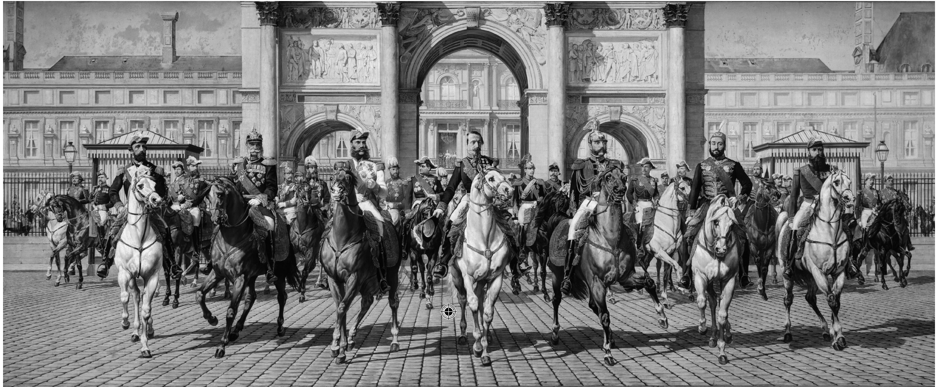
»Les Souverains venus à Paris en 1867 pour l'exposition universelle«. Gemälde von Charles Porion (1814–1908).

Alexander II. stand allerdings nicht der Sinn nach hoher Politik und langatmigen Konferenzen. Gleich nach Überqueren der französischen Grenze hatte er sich eine Loge für Jacques Offenbachs neue Operette »Die Großherzogin von Gerolstein« reservieren lassen. 9 Zu einem Vergnügen wurde seine Reise nach Paris dennoch nicht. Das Pariser Publikum verübelte dem Zaren die Unterdrückung der Polen, die sich 1863 ein weiteres Mal nach 1830 vergeblich gegen ihre russischen Zwingherren erhoben hatten, und schrie bei jeder Gelegenheit: Vive la Pologne . Als der polnische Freischärler Antoni Berezowski am 6. Juni