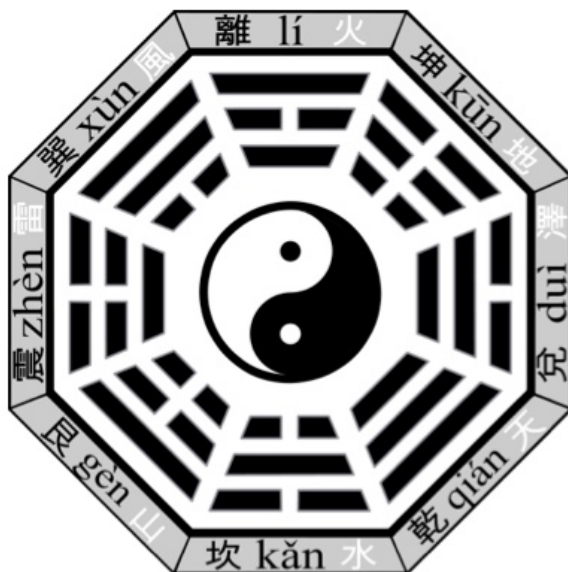
Figura 2. El Pa Kua de la filosofía China. Se puede traducir al español como “ocho estados de cambio”. Representa las leyes que rigen el mundo y da las pautas para entenderlo.