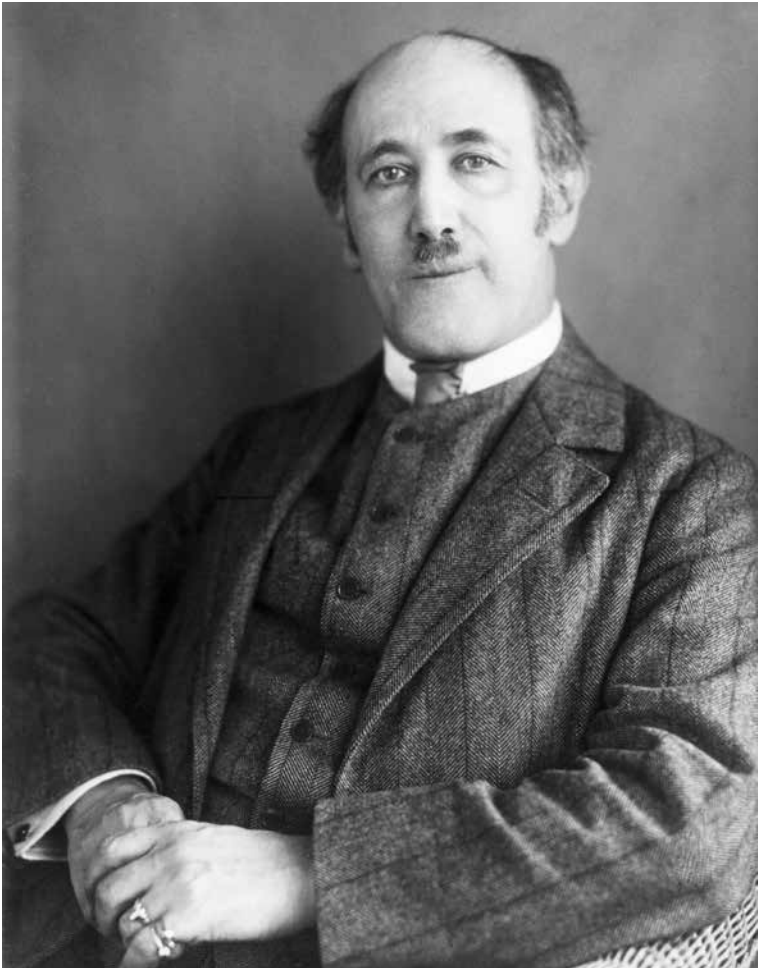
Alfred Kerr (1867–1948). Deutscher Schriftsteller jüdischer Abstammung, Theaterkritiker und Journalist – und Vater von Judith Kerr.