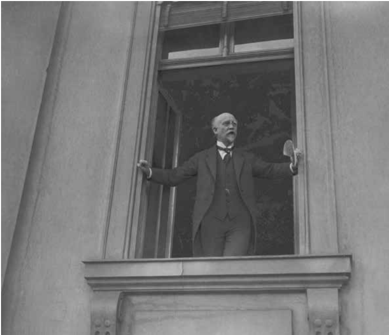
Ein historischer Augenblick: der 9. November 1918. Philipp Scheidemann ruft auf dem Balkon des Deutschen Reichstags die Republik aus.

Gefängnis und schrieb dort bis zu seiner Entlassung im Dezember 1924 seine politisch-weltanschauliche Schrift Mein Kampf .