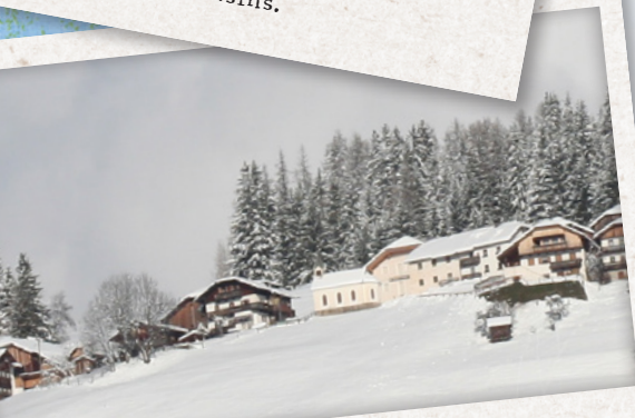
Der Hof meiner Großeltern.