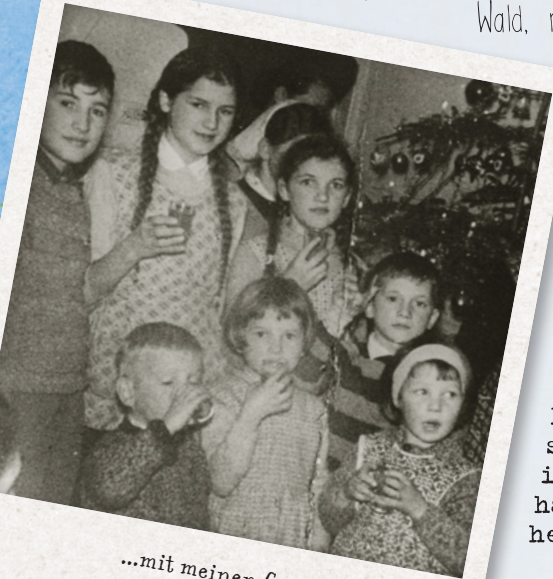
...mit meinen Cousins und Cousins.