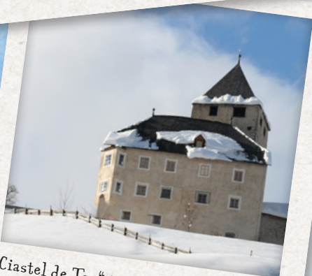
„Castel de Tor“ in St. Martin in Thurn, wo meine Großmutter aufgewachsen ist. Heute befindet sich darin das ladinische Museum.