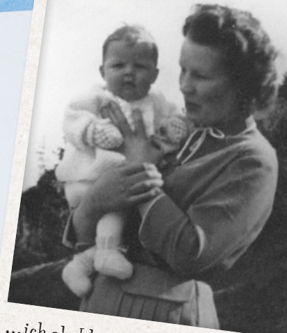
...ich als kleines Kind in den Armen meiner geliebten Mama.

...ein kleines Mädchen, das in einem idyllischen ladinischen Bergdorf in Südtirol aufwuchs. Seine alleinerziehende Mutter, die aus einer zwölköpfigen Bauernfamilie stammte, bescherte dem kleinen Mädchen eine bescheidene, aber glückliche Kindheit, denn das Mädchen spielte und bastelte tagtäglich mit seinen Freunden aus dem Dorf im Wald, mitten in der Natur. Eine Zeit, die es für seinen späteren Beruf sehr prägte.