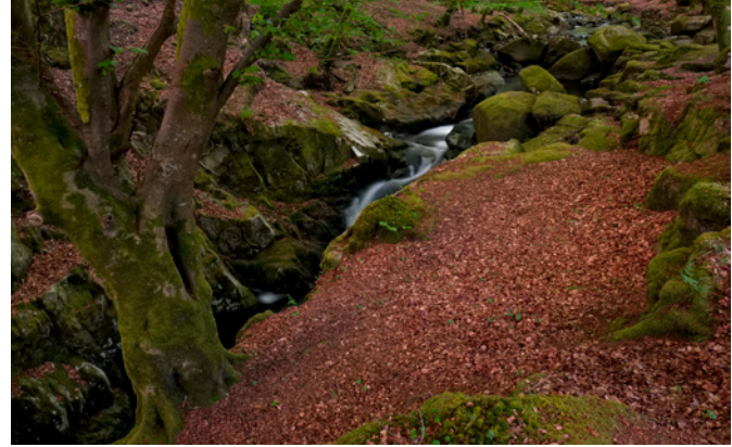
In den Wicklow Mountains. 24 mm · ISO 200 · Blende 10 · 18s · Polfilter

Im Allgemeinen ist die Ostküste am besten für Sonnenaufgänge, die Westküste am besten für Sonnenuntergänge geeignet. Für Sonnenuntergänge an der Nordküste sollte man seinen Besuch im Sommer planen (am besten um die Sommersonnenwende im Juni), Sonnenuntergänge an der Südküste fotografiert man am besten in den Wintermonaten. Wie immer in der Landschaftsfotografie bringen die frühen Morgen- und Abendstunden das beste Licht. Sollte das Licht ausbleiben, bietet die irische Wolkenlandschaft oft eine gute Entschädigung. Die irischen Wolken kommen in vielen dramatischen Variationen daher und