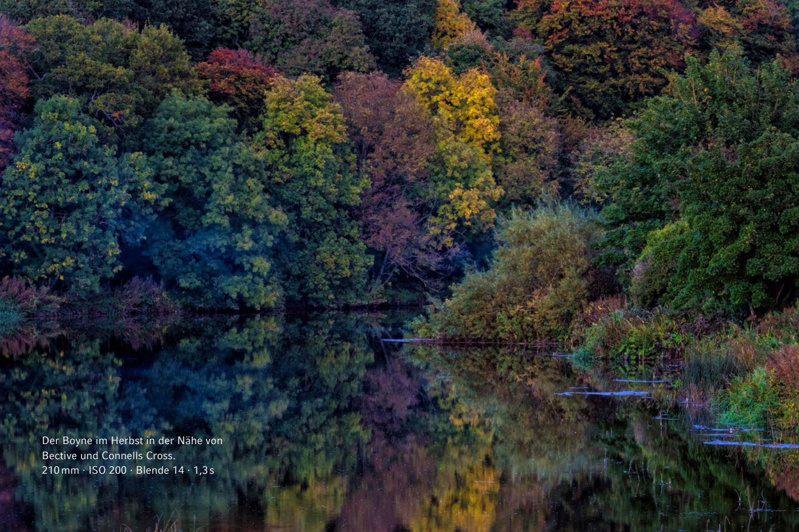
Der Boyne im Herbst in der Nähe von Bective und Connells Cross. 210 mm · ISO 200 · Blende 14 · 1,3s