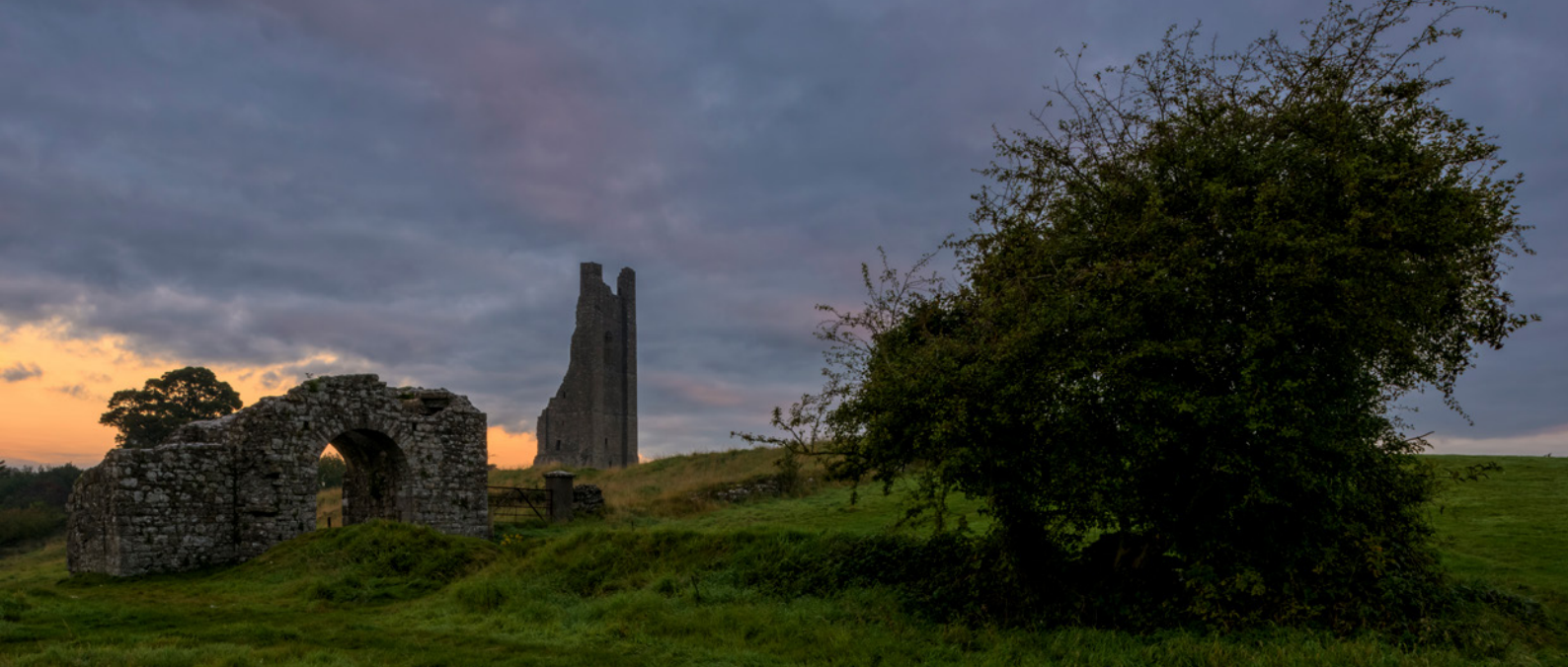
Trim, eine der vielen historischen Städte im Osten Irlands. 24 mm Tilt & Shift · ISO 64 · Blende 16 · 0,5s

mit langen Belichtungszeiten verwacklungsfrei fotografieren und eine optimale Schärfentiefe erzielen konnte. Lediglich die Tierfotos im Wildlife-Kapitel wurden aus der freien Hand fotografiert.