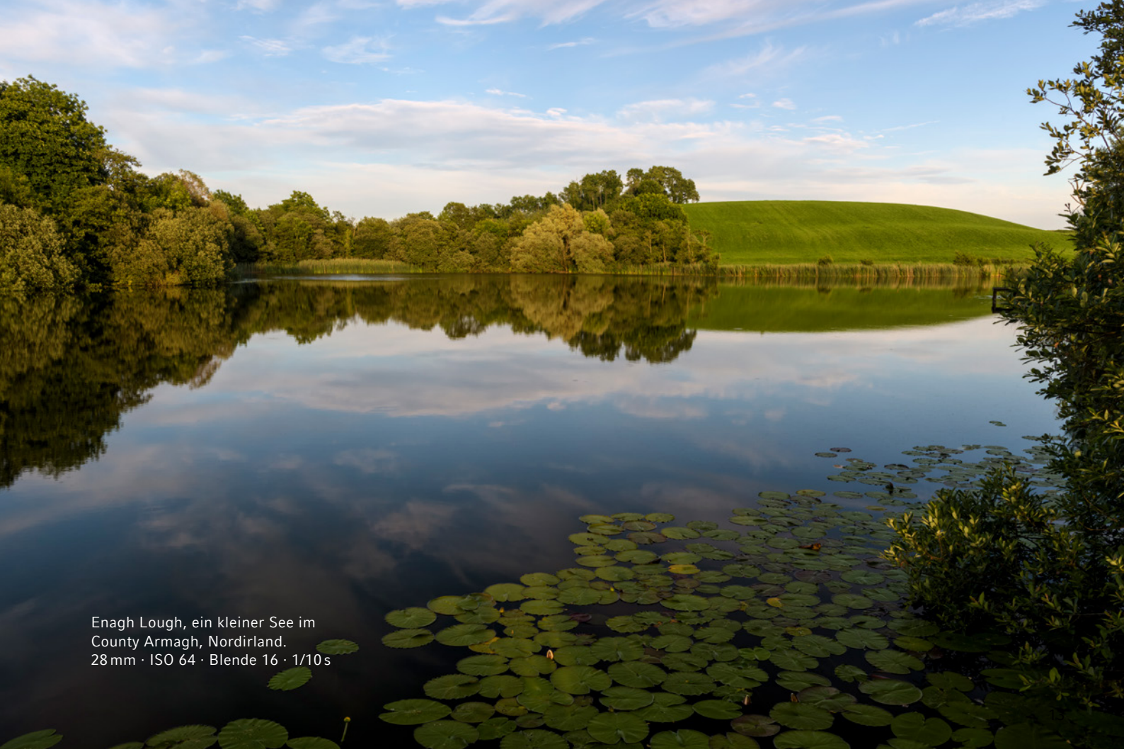
Enagh Lough, ein kleiner See im County Armagh, Nordirland. 28 mm · ISO 64 · Blende 16 · 1/10 s