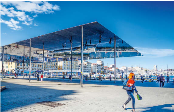
L'Ombrière, »der Schatten«, heißt das 2010 von Norman Foster geschaffene Spiegeldach am Quai des Belges im alten Hafen von Marseille.

gigkeit, gleichzeitig sah man die Notwendigkeit eines geeinten Europas im Interesse einer stabileren politischen Situation. Die Europäische Union wurde im Jahr 1955 auf der Konferenz von Messina ins Leben gerufen. 1995 wurde mit der »Erklärung von Barcelona« die Euro-Mediterrane Partnerschaft (EUROMED) gegründet. Daraus erwuchs 2008 die Union für den Mittelmeerraum (UfM), in der 43 Anrainerstaaten sich zur Förderung von Stabilität und Integration des Mittelmeerraums verpflichten. Heute sieht man sich mit zahlreichen Anforderungen konfrontiert. So suchen Menschen von der afrikanischen und vorderasiatischen Küste, die vor politischen und terroristischen Bedrohungen fliehen, an den Küsten Europas nach einem besseren Leben. Aber auch das Bestreben um einen nachhaltigeren Umgang mit der Natur ist vielerorts spürbar, denn die Küsten und das Meer bedeuten für Millionen Menschen ein Zuhause und ihre Existenz.