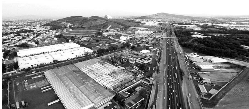
Fotografía: Pablo Vázquez Piombo, 2015.