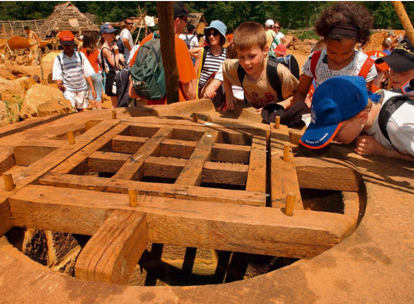
OBEN: Guédelon begeistert als kinderfreundliche Baustelle für tolle Zeitreisen ins Mittelalter. UNTEN: Die Herstellung von Dachschindeln aus Holz ist eine handwerkliche Herausforderung.