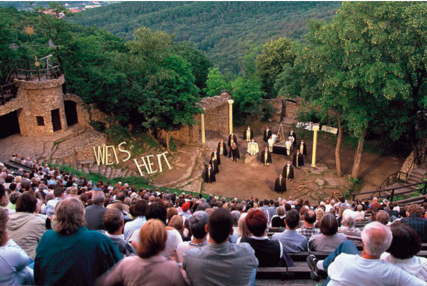
Allein die Lage sorgt schon für Theatralik im Harzer Bergtheater auf dem Hexentanzplatz.

te, wird zu einer ganz besonderen Spielstätte mit vollkommen verschiedenen Aufführungen.