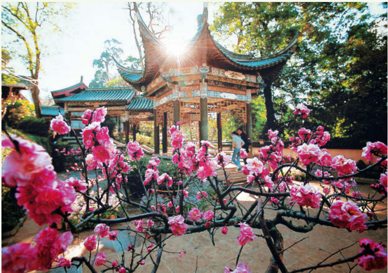
Pavillons am Teich des Schwarzen Drachen im Norden von Lijiang in der Provinz Yunnan

In vielen Regionen des Landes sind Natur und Kultur eine enge Symbiose eingegangen und insbesondere die Gebirge sind oft heilige Stätten der Mythologie, des Buddhismus und des Daoismus. Die Besteigung der mythischen heiligen Berge Tai Shan und Hua Shan , Wanderungen in den buddhistischen Bergregionen des alpinen Wutai Shan und mächtigen Emei Shan oder den heiligen Bergen des Daoismus wie dem Wudang Shan gehören zu den großartigen Erlebnissen, die einen tief in das spirituelle Leben Chinas eintauchen lassen.